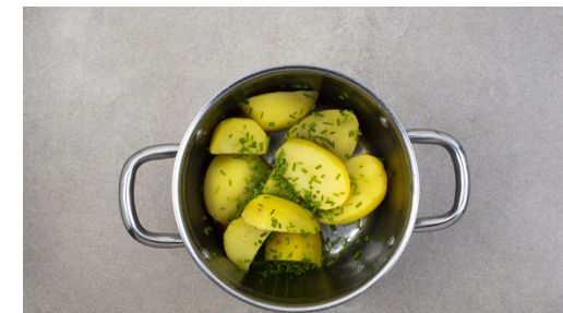
6. Kartoffeln verfeinern

In einem weiteren mittelgroßen Topf ca. 1L Wasser aufkochen und das Brügewürz darin auflösen. Die ½ der Semmelbrösel mit ca. 50ml Wasser in einer Schüssel verrühren. Die Petersilienblätter von den Stängeln zupfen und fein hacken. Die ½ der Kapern grob hacken.