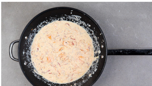
4. Sauce kochen

In einem großen Topf ausreichend gesalzenes Wasser für die Pasta zum Kochen bringen. Die Zwiebel schälen, halbieren und in feine Streifen schneiden. Den Knoblauch schälen und in feine Scheibchen schneiden.