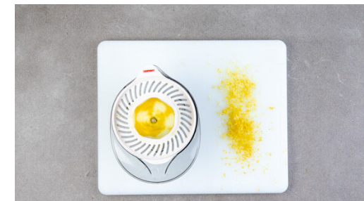
3. Zitrone vorbereiten

Die Zitronenschale abreiben, dann die Zitrone halbieren und auspressen.