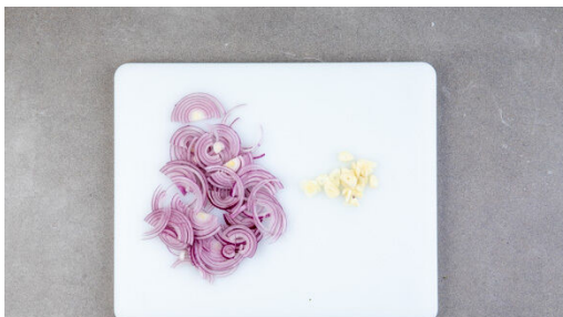
1. Zwiebel schneiden

Energie 724kcal, Fett 31.4g, Kohlenhydrate 82.0g, Eiweiß 26.2g