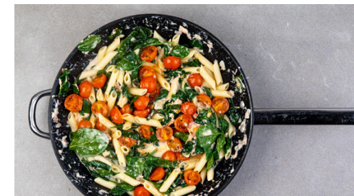
6. Pasta fertigstellen

Die Zitronenschale abreiben, dann die Zitrone halbieren und auspressen.