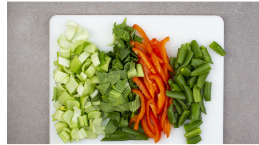
Den Pak Choi am Strunk dünn abschneiden. Die grünen Blätter und den weißen Strunk getrennt in ca. 1 cm breite Streifen schneiden. Die Paprika vierteln, entkernen und in ca. 0,5cm dünne Streifen schneiden.