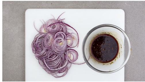
In einem Wasserkocher 1L Wasser für die Nudeln zum Kochen bringen. Den Ingwer und den Knoblauch schälen und fein würfeln, dann mit der Teriyakisauc e, 1EL Pflanzenöl, 1EL Essig sowie Salz und Pfeffer verrühren. Die Zwiebel schälen, halbieren und in feine Streifen schneiden.

Energie 691kcal, Fett 32.8g, Kohlenhydrate 65.9g, Eiweiß 30.3g