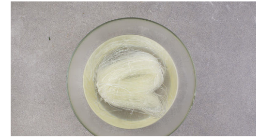
Die Nudeln mit dem kochenden Wasser übergießen, 1 Prise Salz unterrühren und die Nudeln ca. 5Min. im Wasser ziehen lassen. In ein Sieb abgießen. Den Sesam in einer kleinen Pfanne bei mittlerer Hitze 1-2Min. anrösten. Vorsicht , er kann schnell zu dunkel werden. Den Sesam aus der Pfanne nehmen und beiseitestellen.