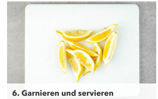
6. Garnieren und servieren

Die Zitronenschale abreiben und mit der Harissapaste vermengen. Den Fisch mit kaltem Wasser abspülen, trocken tupfen und evtl. vorhandene Gräten mit einer Pinzette entfernen. Den Fisch mit der Haut nach unten auf das Ofengemüse legen, mit der Zitronen-Harissa bestreichen und das Gemüse weitere 7-10Min. rösten, bis auch der Fisch gar ist.