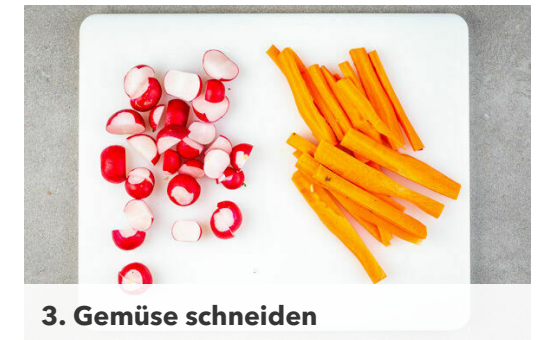
3. Gemüse schneiden

Die Kartoffeln und die Zwiebeln auf zwei mit Backpapier ausgelegten Backblechen verteilen, mit jeweils 1EL Olivenöl, 1TL Oregano , ½TL Salz und 1 Prise Pfeffer vermengen und im Ofen 5-10Min. rösten.