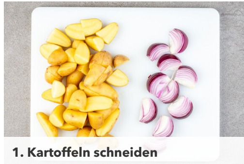
1. Kartoffeln schneiden

Energie 578kcal, Fett 25.3g, Kohlenhydrate 55.1g, Eiweiß 28.3g