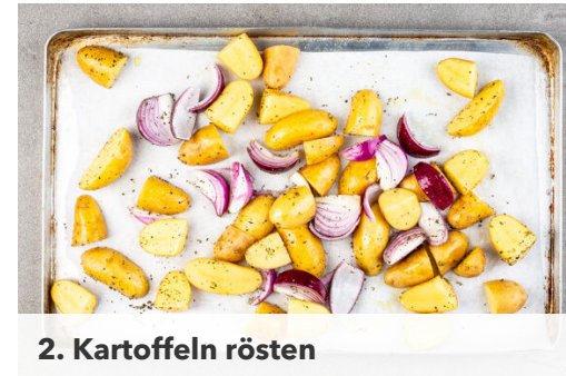
2. Kartoffeln rösten

Den Backofen auf 240°C (220°C Umluft) vorheizen. Die Kartoffeln samt Schale je nach Größe halbieren oder vierteln. Die Zwiebel schälen und in ca. 1cm breite Spalten schneiden.