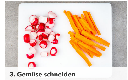
3. Gemüse schneiden

Die Kartoffeln und die Zwiebeln auf einem mit Backpapier ausgelegten Backblech mit 1EL Olivenöl, 1TL Oregano , ½TL Salz und 1 Prise Pfeffer vermengen und im Ofen 5-10Min. rösten.