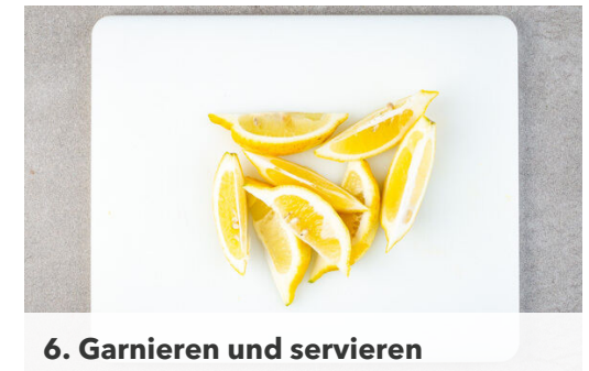
6. Garnieren und servieren

Die Zitronenschale zur Hälfte abreiben und mit der ½ der Harissapaste vermengen. Den Fisch mit kaltem Wasser abspülen, trocken tupfen und evtl. vorhandene Gräten mit einer Pinzette entfernen. Den Fisch mit der Haut nach unten auf das Ofengemüse legen, mit der Zitronen-Harissa bestreichen und das Gemüse weitere 7-10Min. rösten, bis auch der Fisch gar ist.