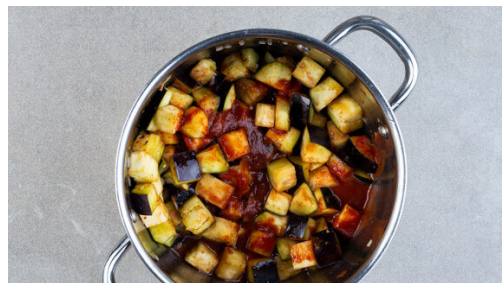
4. Ragout kochen

Die Pitabrotstücke mit der \frac{1}{2} der Nordafrikanischen Gewürzmischung , 2EL Olivenöl und 1 kräftigen Prise Salz vermengen, auf einem mit Backpapier ausgelegten Backblech verteilen und im Ofen in 10-11Min. knusprig und goldbraun backen. Die Croûtons nach der Hälfte der Backzeit wenden.