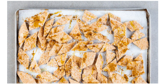
3. Pita backen

Die Auberginen und die Schalotten in einem mittelgroßen Topf mit 1EL Olivenöl und 1 kräftigen Prise Salz bei mittlerer bis starker Hitze 4-5Min. anbräunen. \frac{2}{3} der Harissapaste einrühren und ca. 1Min. mitbraten.