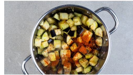
2. Gemüse braten

Den Backofen auf 220°C (200°C Umluft) vorheizen. Die Auberginen in 1-2cm große Würfel schneiden. Die Schalotte schälen und grob würfeln. Die Pitabrote in ca. 3cm große Stücke schneiden.