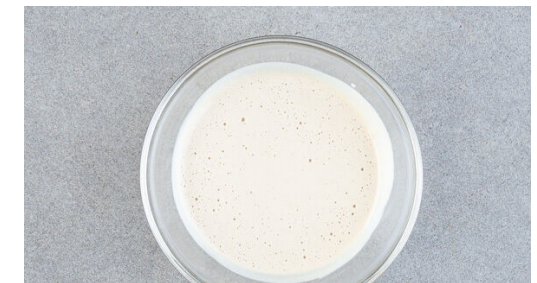
6. Joghurt würzen

Die Tomaten in kleine Würfel schneiden. Die Paprika vierteln, entkernen und ebenfalls in kleine Würfel schneiden. Die Tomaten und die Paprika mit 1EL Essig und 1 kräftigen Prise Salz würzen. Die Petersilie samt Stängeln grob schneiden.