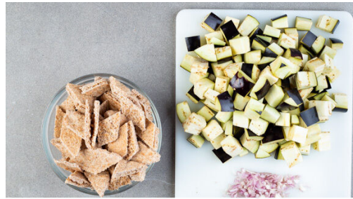
1. Zutaten schneiden

Energie 918kcal, Fett 33.0g, Kohlenhydrate 120.8g, Eiweiß 26.4g