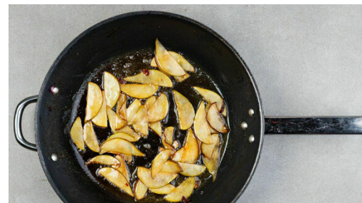
5. Birnen anbraten

Die Zwiebeln schälen, halbieren und in dünne Streifen schneiden, dann in einer mittelgroßen Pfanne mit 2EL Olivenöl und 1 kräftigen Prise Salz bei mittlerer Hitze in 7-8Min. weich braten, dabei gelegentlich umrühren. 2EL Balsamicoessig und 2EL Honig einrühren und die Zwiebeln bei niedriger Hitze ca. 1Min. klebrig karamellisieren. Aus der Pfanne nehmen und beiseitestellen.