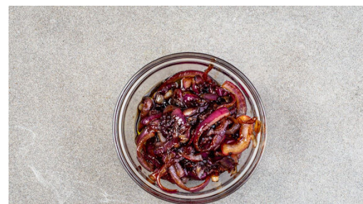
2. Zwiebeln karamellisieren

Den vorgebackenen Teig aus dem Ofen nehmen, das Backpapier und Backgewicht entfernen, anschließend die Zwiebeln gleichmäßig darauf verteilen. Den Käse mit einem kleinen Löffel auf die Zwiebeln klecksen. Den Teig mit der Ei-Mischung füllen und im Ofen 20-25Min. backen, bis die Füllung gestockt ist. Die Quiche ca. 5Min. auskühlen lassen.