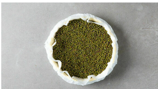
1. Teig vorbacken

Energie 936kcal, Fett 69.5g, Kohlenhydrate 52.1g, Eiweiß 23.9g