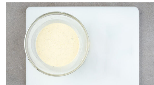
3. Füllung vorbereiten

Inzwischen die Birnen vierteln, entkernen und in dünne Scheiben schneiden. Die Pfanne auswischen und 1EL Butter bei mittlerer Hitze darin erwärmen, dann die Birnen zugeben und auf beiden Seiten ca. 3Min. goldbraun anbraten. 2TL Honig zugeben und ca. 1Min. erwärmen.