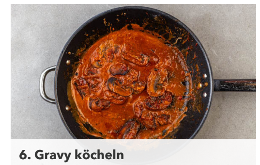
6. Gravy köcheln

Das Tomatenmark und die restliche Gewürzmischung zu den Pilzen geben und ca. 2Min. mitbraten, dann 1EL Mehl einrühren.