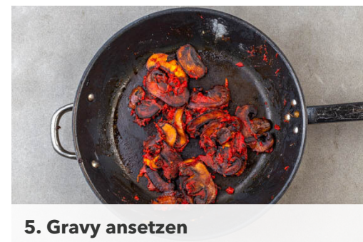
5. Gravy ansetzen

Den Knoblauch schälen und sehr fein würfeln oder durch eine Knoblauchpresse drücken. Den Joghurt mit dem Knoblauch sowie je 1 Prise Gewürzmischung , Salz und Pfeffer vermengen, dabei ggf. mit mehr Gewürzmischung , Salz und Pfeffer nachwürzen. Die Tomate grob würfeln und mit 1 kräftigen Prise Salz vermengen. Den Romanasalat in ca. 2cm breite Streifen schneiden.