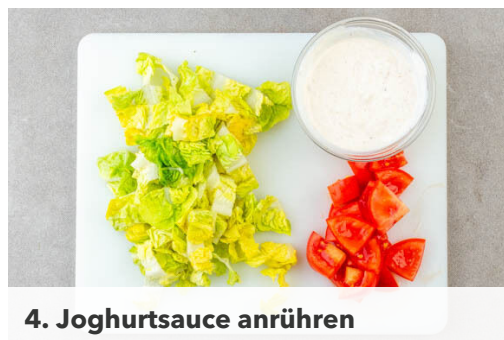
4. Joghurtsauce anrühren

Die weißen Lauchzwiebelringe in einer mittelgroßen Pfanne mit 1EL Olivenöl bei mittlerer Hitze in ca. 1Min. glasig anbraten. Die Pilze , 1EL Balsamicoessig und je 1 kräftige Prise Pfeffer in die Pfanne geben und bei mittlerer bis starker Hitze unter gelegentlichem Rühren 6-8Min. braten, bis die Pilze weich sind.