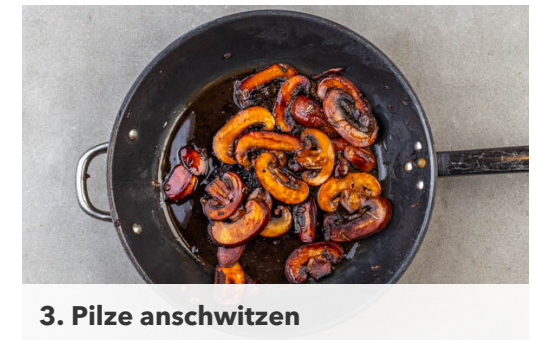
3. Pilze anschwitzen

Die Kartoffelspalten auf einem mit Backpapier ausgelegten Backblech mit 1EL Olivenöl und ½TL Salz vermengen und gleichmäßig verteilen, dann im Ofen 20-24Min. backen, bis die Kartoffelspalten goldbraun und gar sind. Nach der Hälfte der Zeit wenden.