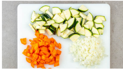
1. Gemüse schneiden

Energie 958kcal, Fett 40.0g, Kohlenhydrate 94.5g, Eiweiß 52.0g