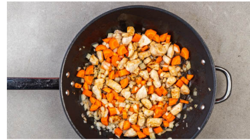
2. Sauce ansetzen

Die Zucchini in die Pfanne geben und 2-4Min. braten, bis sie leicht weich werden. Dann die ½ der Gewürzmischung zugeben und 30-60Sek. unter stetigem Rühren mitbraten. Die passierten Tomaten zugeben und einmal aufkochen lassen, dann die Sauce bei niedriger Hitze sanft köcheln lassen, bis die Pasta gekocht ist.