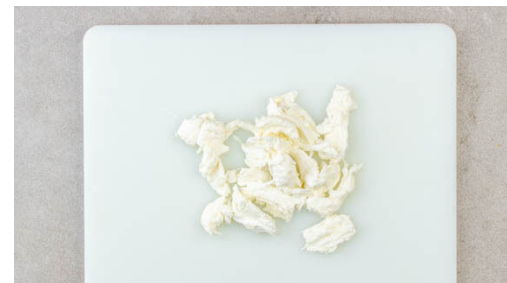
5. Mozzarella vorbereiten

Das Fleisch trocken tupfen und in einer mittelgroßen Pfanne mit 1EL Olivenöl und 1EL Butter bei mittlerer Hitze 2-3Min. anbraten. Die Zwiebeln und die Karotten zugeben, mit je ½TL Salz und Pfeffer würzen und 3-4Min. weiterbraten, bis die Zwiebeln glasig sind.