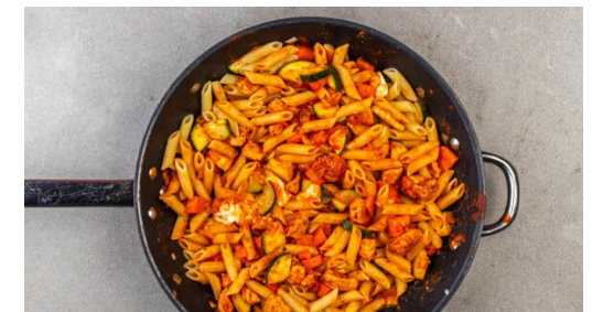
6. Pasta fertigstellen

Die Pasta in das kochende Wasser geben und in 7-9Min. bissfest kochen. Mit einer Tasse etwas Pastawasser abschöpfen, dann die Pasta in ein Sieb abgießen und abtropfen lassen.