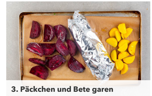
3. Päckchen und Bete garen

Die ½ des Basilikums samt Stängeln grob schneiden und mit dem restlichen Spinat , 1EL Olivenöl, 1TL Essig, 1TL Senf und 1 kräftigen Prise Salz in einem hohen Gefäß mit einem Stabmixer möglichst fein pürieren. Ggf. löffelweise Wasser hinzufügen, falls das Dressing zu dickflüssig ist.