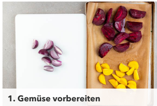
1. Gemüse vorbereiten

Energie 851kcal, Fett 34.3g, Kohlenhydrate 101.7g, Eiweiß 28.4g