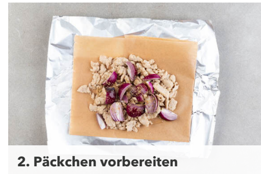
2. Päckchen vorbereiten

Den Perlencouscous in das kochende Wasser rühren und abgedeckt bei mittlerer Hitze 8-10Min. sanft köcheln lassen, bis das Wasser aufgesaugt und der Perlencouscous gar ist. In den letzten 30Sek.-1Min. der Garzeit die ½ des Spinats unterheben und den Perlencouscous mit 1EL Olivenöl und je 1 Prise Salz und Pfeffer würzen. Tipp: Der Spinat muss nicht ganz zusammenfallen.