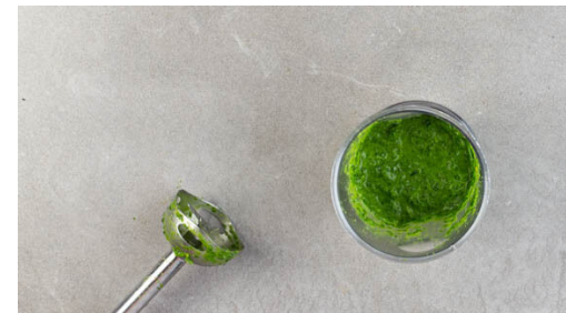
5. Dressing pürieren

Die ½ der Fenchelsamen mit einem Mörser und Stößel zerstoßen. Ein ca. 15x15cm großes Stück Backpapier mittig auf ein ca. 30x30cm großes Stück Alufolie legen. Die vegane Hähnchenschnitzel und die Zwiebeln auf das Backpapier geben und mit den Fenchelsamen , 1EL Olivenöl und 1 Prise Salz vermengen.