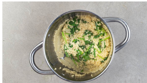
4. Perlencouscous kochen

Den Backofen auf 240°C (220°C Umluft) vorheizen. In einem mittelgroßen Topf 400ml leicht gesalzenes Wasser zum Kochen bringen. Die Beten schälen, in ca. 1cm breite Spalten schneiden und auf einem mit Backpapier ausgelegten Backblech mit 1EL Olivenöl sowie 1 kräftigen Prise Salz vermengen. Die Zwiebel schälen, halbieren und in ca. 2cm breite Spalten schneiden.