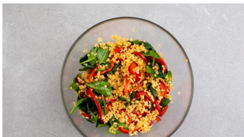
4. Bulgur mischen

Den Backofen auf 180°C Umluft (200°C Ober-/Unterhitze) vorheizen. In einem mittelgroßen Topf 1L Wasser für den Bulgur zum Kochen bringen. Den Lachs in 4 gleich große Stücke schneiden, dabei ggf. Gräten entfernen. Auf ein mit Backpapier ausgelegtes Backblech geben und mit Salz und Pfeffer sowie der 1/2 der Gewürzmischung würzen. 10-15Min. backen, bis der Fisch gerade gar ist.