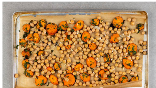
4. Kichererbsen rösten

Inzwischen die Kichererbsen in ein Sieb abgießen, mit kaltem Wasser abspülen und abtropfen lassen. Den Knoblauch schälen, grob würfeln und mit den Kichererbsen vermengen.