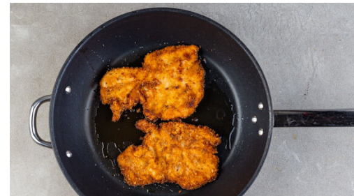
5. Schnitzel braten

Die Kartoffeln samt Schale in einem mittelgroßen Topf mit leicht gesalzenem Wasser bedecken und zum Kochen bringen, dann ca. 12Min. kochen lassen. Inzwischen aus 1EL Olivenöl, 1EL Essig und je 1 Prise Salz, Pfeffer und Zucker ein Dressing anrühren.