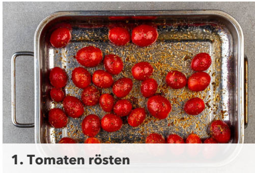
1. Tomaten rösten

Energie 1187kcal, Fett 68.5g, Kohlenhydrate 87.4g, Eiweiß 51.3g