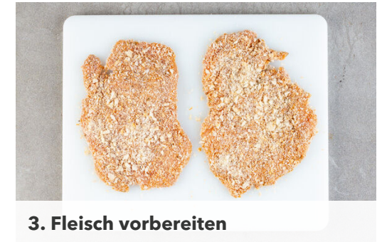
3. Fleisch vorbereiten

Die Schnitzel in einer mittelgroßen Pfanne mit 2EL Olivenöl bei mittlerer Hitze auf jeder Seite 2-3Min. goldbraun ausbacken. Anschließend auf etwas Küchenkrepp abtropfen lassen. Die Burgerbrötchen aufschneiden und 2-3Min. im Ofen aufbacken. Den Rucola mit dem Dressing vermengen. Den Mozzarella in dicke Scheiben schneiden.