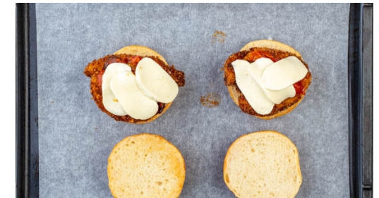
6. Käse schmelzen

1EL Mayonnaise mit 1EL Ketchup verrühren. Das Fleisch trocken tupfen, horizontal zu 2 Schnitzeln halbieren und mit einem Fleischklopfer oder einer schweren Pfanne leicht plattieren. Von beiden Seiten mit der restlichen Gewürzmischung , je 1 Prise Salz und Pfeffer und dem Mayo-Ketchup-Mix einreiben, dann in der ½ des Panko-Paniermehls wenden.