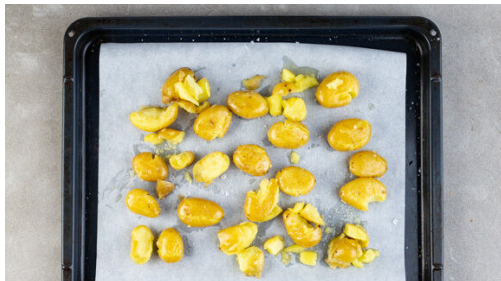
4. Kartoffeln quetschen

Den Backofen auf 240°C (220°C Umluft) vorheizen. Die Kirschtomaten in eine kleine bis mittelgroße Auflaufform geben und mit 2EL Olivenöl, der ½ der Gewürzmischung und je 1 Prise Salz und Pfeffer würzen. Die Tomaten ca. 20Min. im Ofen backen, bis sie weich und aufgeplatzt sind. Anschließend mit einer Gabel grob zerdrücken.