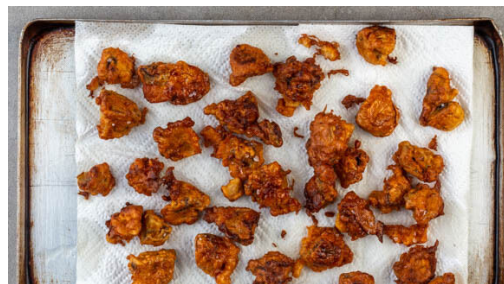
4. Pilze braten

Die Lauchzwiebeln in feine Ringe schneiden. Die Kapern grob hacken. Die Zitrone halbieren und auspressen. 3EL Mayonnaise, die Sriracha-Sauce , die Kapern , 1EL Zitronensaft und die ½ der Lauchzwiebeln zu einer Remoulade verrühren. Nach Geschmack mit Pfeffer würzen.