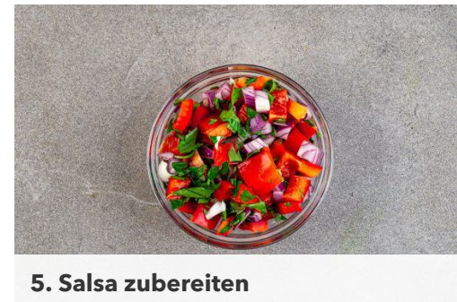
5. Salsa zubereiten

Den Koriander samt Stängeln grob schneiden. Den Knoblauch schälen und fein reiben. Die Chiliflocken abgießen, mit dem Knoblauch in den Topf geben und ca. 1Min. mitbraten. Mit den passierten Tomaten , 2TL Essig und der übrigen Sojasauce ablöschen. Die ½ des Korianders und 1 kräftige Prise Zucker zugeben, aufkochen und bei niedriger Hitze abgedeckt ca. 5Min. köcheln.