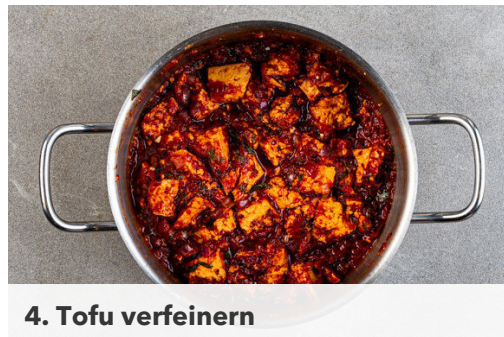
4. Tofu verfeinern

Den Tofu mit den Fingern in mundgerechte Stücke zerkrümeln, dann mit der ½ der Sojasauce und der restlichen Gewürzmischung vermengen. In einem großen Topf 2EL Pflanzenöl erhitzen, den Tofu und ⅔ der Zwiebeln ins heiße Öl geben und bei mittlerer Hitze ca. 5Min. braten, bis die Zwiebeln weich und leicht gebräunt sind. Regelmäßig umrühren.