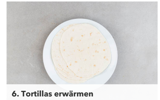
6. Tortillas erwärmen

Die Paprika halbieren, entkernen und in ca. 1cm kleine Würfel schneiden, dann mit den restlichen Zwiebeln , 2EL Essig und dem restlichen Koriander vermengen. Mit Salz abschmecken.