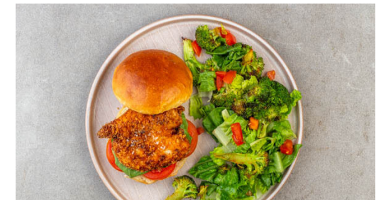
6. Burger fertigstellen

1EL Mayonnaise mit 1EL Ketchup verrühren. Das Fleisch trocken tupfen, jeweils horizontal zu 2 Schnitzeln halbieren und mit einem Fleischklopper oder einer schweren Pfanne leicht plattieren. Von beiden Seiten mit der restlichen Gewürzmischung , je 1 kräftigen Prise Salz und Pfeffer und dem Mayo-Ketchup-Mix einreiben, dann im Panko-Paniermehl wenden.