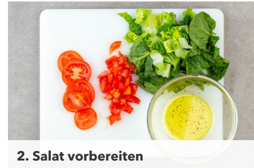
2. Salat vorbereiten

Die Schnitzel in einer großen Pfanne mit 3EL Olivenöl bei mittlerer Hitze auf jeder Seite 2-3Min. goldbraun ausbacken. Anschließend auf etwas Küchenkrepp abtropfen lassen.