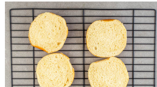
5. Brötchen aufbacken

Den Salat in mundgerechte Stücke schneiden. 2 Tomaten in dünne Scheiben schneiden, die übrige Tomate grob würfeln. In einer Salatschüssel 3EL Olivenöl, 2EL Essig und je 1 kräftige Prise Salz, Pfeffer und Zucker zu einem Dressing verrühren.