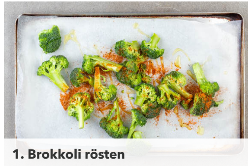
1. Brokkoli rösten

Energie 725kcal, Fett 38.1g, Kohlenhydrate 52.1g, Eiweiß 40.3g