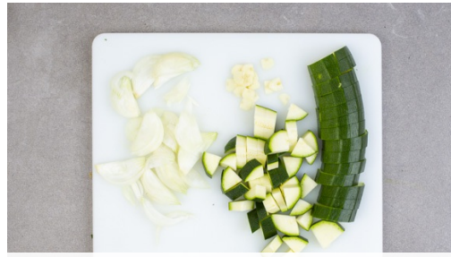
Den Backofen auf 200°C Umluft (220°C Ober-/Unterhitze) vorheizen. Die Zucchini längs vierteln und in ca. 1cm kleine Stücke schneiden. Die Zwiebel schälen, halbieren und in feine Streifen schneiden. Den Knoblauch schälen, halbieren und in feine Scheibchen schneiden.

Gluten (1), Fisch (4), Schwefeldioxid und Sulphite (12). Kann Spuren von anderen Allergenen enthalten.