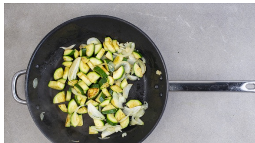
Die Hitze reduzieren, die Zwiebeln und den Knoblauch zugeben und 1-2Min. mitbraten. Inzwischen die Oliven abgießen und halbieren.