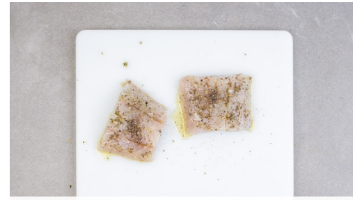
Den Fisch in 2 gleich große Stücke schneiden. Vorsicht , der Fisch kann Gräten enthalten. Diese am besten jetzt mit einer Pinzette entfernen oder später beim Essen darauf achten. Die 1/2 der Provencekräuter mit 1-2EL Olivenöl verrühren und den Fisch mit dem Gewürzöl sowie Salz und Pfeffer einreiben.