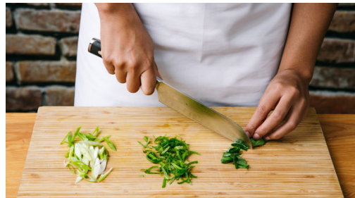
4. Lauchzwiebel schneiden

In einem mittelgroßen Topf 400ml leicht gesalzenes Wasser zum Kochen bringen. Den Reis in einem Sieb unter fließendem Wasser abspülen, bis das Wasser klar bleibt. Sobald das Wasser kocht, den Reis hineingeben und abgedeckt bei niedrigster Hitze 10-12Min. kochen, bis das Wasser aufgesogen und der Reis gar ist. Noch ca. 5Min. ohne Hitzezufuhr ziehen lassen.