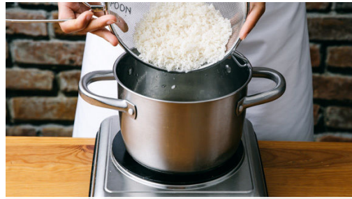
1. Reis kochen

In einem mittelgroßen Topf 400ml leicht gesalzenes Wasser zum Kochen bringen. Den Reis in einem Sieb unter fließendem Wasser abspülen, bis das Wasser klar bleibt. Sobald das Wasser kocht, den Reis hineingeben und abgedeckt bei niedrigster Hitze 10-12Min. kochen, bis das Wasser aufgesogen und der Reis gar ist. Noch ca. 5Min. ohne Hitzezufuhr ziehen lassen.