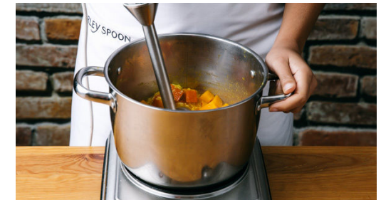
6. Suppe pürrieren

Den Kürbis , die Tomaten , das Zitronengras , die 1/2 der Currypaste oder mehr nach Geschmack und 1EL Pflanzenöl in einen großen Topf geben. 500ml Wasser angießen und abgedeckt zum Kochen bringen, dann 12-15Min. bei mittlerer Hitze köcheln lassen, bis das Gemüse weich ist.