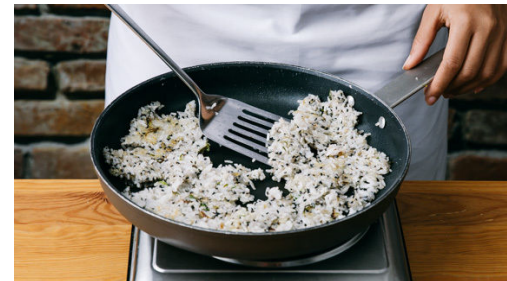
5. Reis anbraten

Den Kürbis halbieren, mit einem Löffel entkernen und in 1-2cm große Würfel schneiden. Die Tomaten vierteln. Die Zitronengrasstangen von den äußeren Schichten befreien und am unteren Ende ca. 3cm abschneiden, dann längs halbieren und mit einer breiten Messerklunge flach klopfen.