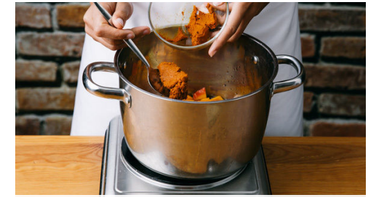
3. Suppe ansetzen

Die Lauchzwiebeln und den Sesam in einer mittelgroßen Pfanne mit 1EL Pflanzenöl bei mittlerer bis starker Hitze 1-2Min. anbraten. Den Reis hinzugeben und so lange braten, bis er kross wird.