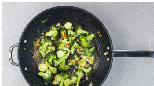
4. Gemüse braten

In einem mittleren Topf 600ml leicht gesalzenes Wasser zum Kochen bringen. Den Brokkoli in mundgerechte Röschen, den Strunk in dünne Scheiben schneiden. Die Lauchzwiebel in dünne Ringe schneiden. Den Knoblauch schälen und in Scheibchen schneiden. Den Ingwer schälen und fein würfeln. Die Paprika entkernen und in Streifen schneiden. Die Peperoni in feine Ringe schneiden.