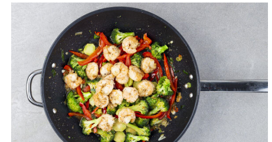
6. Garnelen untermengen

Eine große Pfanne ca. 2cm hoch mit Pflanzenöl befüllen und dieses bei starker Hitze erwärmen. Das Öl ist heiß genug, wenn sich an einem hineingehaltenen Holzlöffel kleine Bläschen bilden. Die Garnelen hineingeben und 2-3Min. braten, bis sie rosa sind. Mit einer Schaumkelle herausheben und auf Küchenkrepp abtropfen lassen. Das Öl bis auf 1EL abgießen.