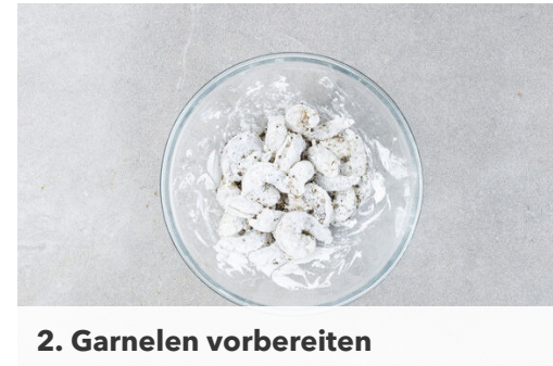
2. Garnelen vorbereiten

Den Knoblauch , den Ingwer und die Peperoni in der Pfanne bei mittlerer bis starker Hitze ca. 1Min. anbraten. Den Brokkoli und \frac{3}{4} der Lauchzwiebeln zugeben und ca. 3Min. mitbraten, dann die Paprika zugeben und das Gemüse weitere 2Min. braten. Mit der Teriyaki- , der Sojasauce und 100-150ml Wasser ablöschen und mit Salz und Pfeffer würzen.