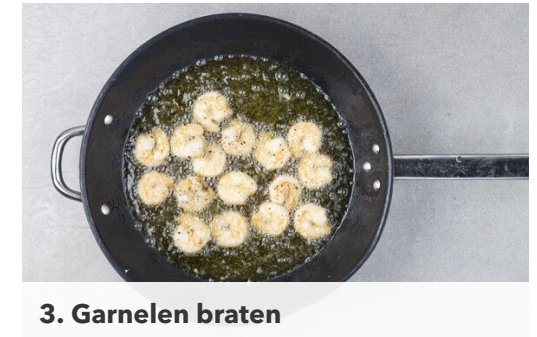
3. Garnelen braten

Den Deckel des Reis-Bechers bis zur gepunkteten Linie öffnen und den Reis in der Mikrowelle 2Min. erwärmen. Tipp: Wer keine Mikrowelle hat, kann den geschlossenen Reis-Becher in einem Topf mit kochendem Wasser ca. 10Min. erhitzen.