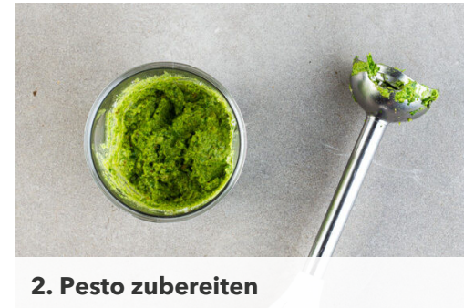
2. Pesto zubereiten

In einem großen Topf ausreichend gesalzenes Wasser für die Pasta zum Kochen bringen. Den Lauch in ca. 1cm breite Ringe schneiden. Den Knoblauch schälen und fein würfeln. Den Hartkäse fein reiben.