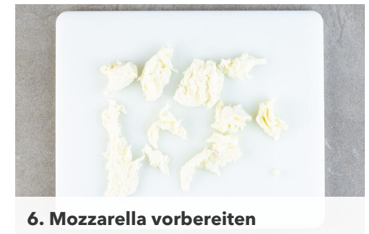
6. Mozzarella vorbereiten

Den Lauch und den restlichen Knoblauch in der Pfanne mit 2EL Olivenöl und 1 kräftigen Prise Salz ca. 4Min. anbraten. Den Spinat unterheben und in 1-2Min. zusammenfallen lassen. Die Pfanne vom Herd nehmen und das Gemüse mit Salz und Pfeffer abschmecken.