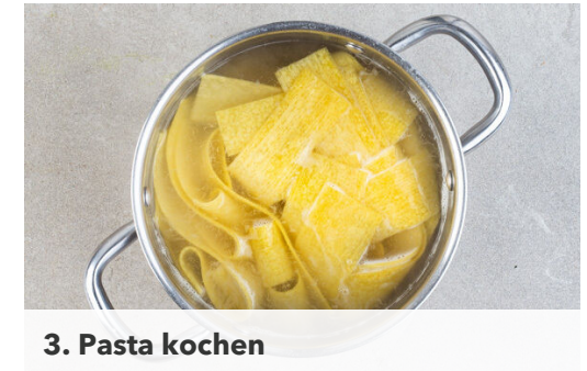
3. Pasta kochen

Die Walnüsse in einer großen Pfanne ohne Zugabe von Fett bei mittlerer Hitze 2-3Min. anrösten. Anschließend in einem hohen Gefäß mit 2 Handvoll Spinat , der ½ des Knoblauchs , dem Käse , der ½ des Trüffelöls , 4EL Wasser und ½TL Salz zu einem cremigen Pesto pürieren. Die Pfanne aufbewahren.