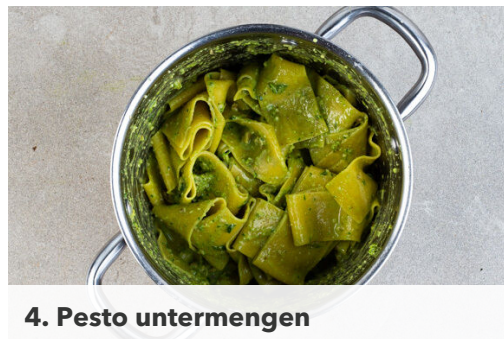
4. Pesto untermengen

Die Lasagneblätter jeweils der Länge nach in 4 breite Streifen schneiden, in das kochende Wasser geben und in ca. 5Min. bissfest kochen. Mit einer Tasse etwas Kochwasser abschöpfen, dann die Pasta in einem Sieb abtropfen lassen.