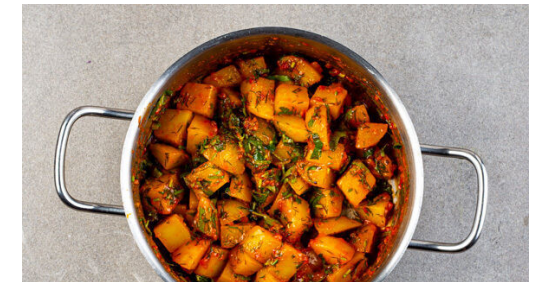
6. Kartoffeln verfeinern

Das Hackfleisch in einer großen Pfanne mit 2EL Pflanzenöl und 1 kräftigen Prise Salz bei starker Hitze ca. 2Min. anbraten, bis es leicht gebräunt ist.