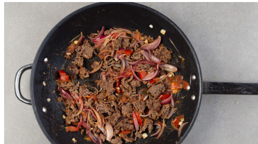
4. Gemüse mitbraten

In einem mittelgroßen Topf ausreichend gesalzenes Wasser für die Kartoffeln zum Kochen bringen. Die Kartoffeln schälen und in 3-4cm große Würfel schneiden, dann in das Wasser geben (es muss noch nicht kochen) und in 12-14Min. weich garen. In ein Sieb abgießen und abtropfen lassen.