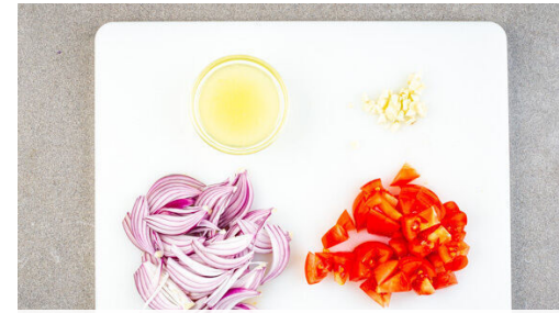
2. Zutaten vorbereiten

Die Zwiebeln , den Knoblauch und die Tomaten in die Pfanne geben und bei mittlerer Hitze ca. 5Min. mitgaren, dabei gelegentlich umrühren. 3-4EL Wasser und 2EL Zitronensaft hinzufügen und weitere ca. 2Min. garen. Mit Salz und Pfeffer abschmecken.