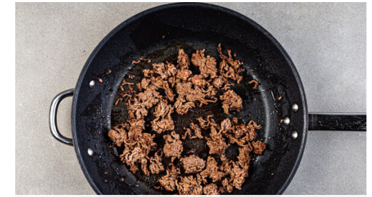
3. Hackfleisch anbraten

Die Orangen schälen und das Fruchtfleisch in kleine Würfel schneiden. Die Gurke längs vierteln und quer in dünne Scheiben schneiden. Die Orangen und ausgetretenen Orangensaft mit den Gurken , 2-3EL Zitronensaft sowie je ½TL Salz und Pfeffer vermengen. Ggf. mit mehr Zitronensaft sowie Salz und Pfeffer abschmecken.