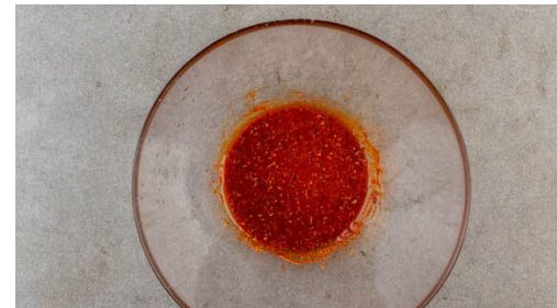
5. Dressing zubereiten

½TL Gewürzmischung für den Salat aufheben. 50g Mehl und die restliche Gewürzmischung in einer Schüssel vermischen. In einer zweiten Schüssel 60ml Milch, 50ml Wasser und 1 Ei verquirlen. Die Milchmischung zur Mehlmischung geben und kurz verrühren, bis ein Teig entsteht.