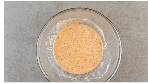
2. Teig zubereiten

Die Pilze in 3-4Min. rundum goldbraun und knusprig braten, dabei gelegentlich mit der Schaumkelle rühren. Die Pilze mit der Schaumkelle aus der Pfanne nehmen und auf einem mit Küchentuch ausgelegtem Backblech abtropfen lassen. Den Vorgang mit den restlichen Pilzen wiederholen.