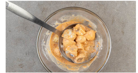
3. Pilze vorbereiten

Die Pilze ggf. mit einem Spritzer der übrigen Zitronenhälfte verfeinern. Die aufbewahrte Gewürzmischung , 1TL Zitronensaft , 1EL Olivenöl und ½TL Honig zu einem Dressing verrühren, mit Salz und Pfeffer abschmecken.