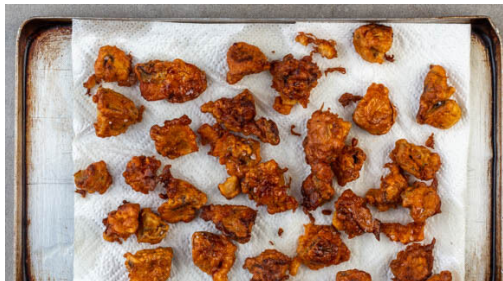
4. Pilze braten

Die Lauchzwiebeln in feine Ringe schneiden. Die Kapern grob hacken. Die Zitrone halbieren und eine Hälfte auspressen, die andere Hälfte aufbewahren. 1½EL Mayonnaise, die Sriracha-Sauce , die Kapern , ½EL Zitronensaft und die ½ der Lauchzwiebeln zu einer Remoulade verrühren. Nach Geschmack mit Pfeffer würzen.