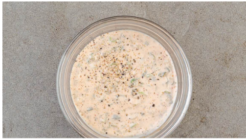
1. Remoulade zubereiten

Energie 786kcal, Fett 50.3g, Kohlenhydrate 69.3g, Eiweiß 15.9g