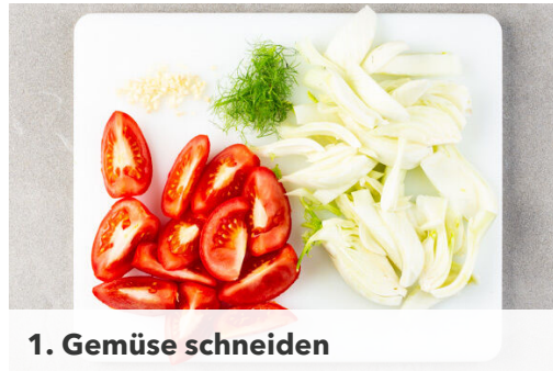
1. Gemüse schneiden

Energie 873kcal, Fett 30.9g, Kohlenhydrate 99.1g, Eiweiß 46.0g