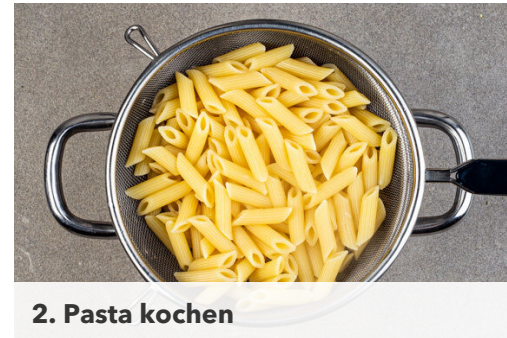
2. Pasta kochen

Den Knoblauch , die Tomaten , den Fenchel und die ½ des Tomatenmarks mit 1TL Zucker und je 1 Prise Salz und Pfeffer in dieselbe Pfanne geben und bei starker Hitze ca. 2Min. anbraten. Mit 75ml Wasser ablöschen, dann das Fleisch auf das Gemüse geben und abgedeckt bei mittlerer Hitze in 5-7Min. gar kochen. Ggf. erneut mit Salz und Pfeffer abschmecken.