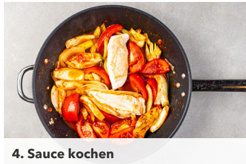
4. Sauce kochen

In einem mittelgroßen Topf ausreichend gesalzenes Wasser für die Pasta zum Kochen bringen. Den Knoblauch schälen und fein würfeln. Die Tomaten in je 6 Spalten schneiden. Das Fenchelgrün grob schneiden. Den Fenchel längs halbieren und in ca. 1cm breite Spalten schneiden, dabei den Strunk entfernen.