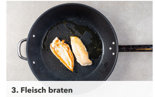
3. Fleisch braten

Inzwischen die ½ des Panko-Paniermehls in einer kleinen Pfanne mit 1EL Butter und 1 kleinen Prise Salz bei mittlerer Hitze 2-3Min. goldbraun anrösten.