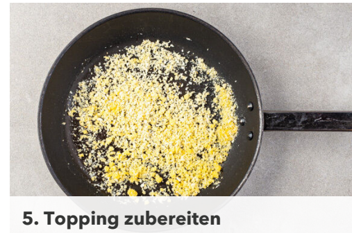
5. Topping zubereiten

Die Pasta in das kochende Wasser geben und in 7-9Min. bissfest kochen. In ein Sieb abgießen und abtropfen lassen.