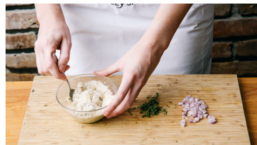
2. Panade vorbereiten

Das Fleisch mit der restlichen Gewürzmischung einreiben und in einer großen, ofenfesten Pfanne mit 1EL Olivenöl bei starker Hitze auf jeder Seite ca. 1Min. scharf anbraten.