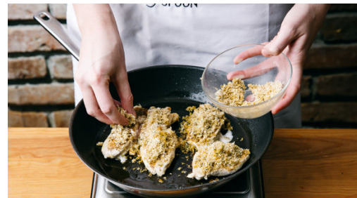
5. Panade auftragen

Inzwischen die Schalotte schälen und in möglichst feine Würfel schneiden. Die Thymianblätter von den Stängeln streifen. Ca. 1EL Butter mit 1-2TL Gewürzmischung glatt rühren, dann das Panko-Paniermehl und die 1/2 des Thymians untermengen.