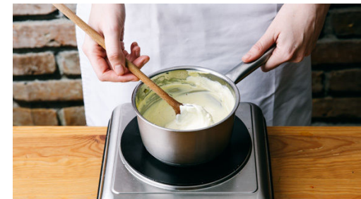
6. Sauce zubereiten

Das Fleisch mit etwas Küchenkrepp trocken tupfen, längs halbieren und unter Klarsichtfolie bedeckt mit einem Fleischklopfer oder dem Boden einer schweren Pfanne ca. 1cm dünn plattieren.