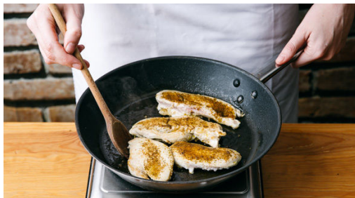
4. Fleisch anbraten

Den Backofen auf 220°C Umluft (240°C Ober-/Unterhitze) vorheizen. Die Kartoffeln samt Schale in Spalten schneiden. Auf einem mit Backpapier ausgelegten Backblech mit 1-2EL Olivenöl sowie Salz und Pfeffer vermengen und im Ofen 20-25Min. rösten. Die Kirschtomaten während der letzten 5-7Min. dazugeben und mitbacken.