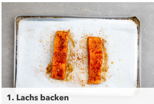
1. Lachs backen

Energie 605kcal, Fett 23.3g, Kohlenhydrate 58.9g, Eiweiß 35.1g