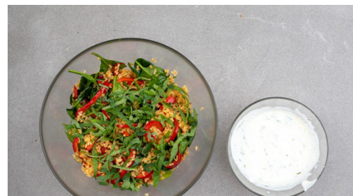
5. Dip zubereiten

Den Bulgur in das kochende Wasser geben, mit 1 kräftigen Prise Salz würzen und in 8-10Min. weich kochen. In ein Sieb abgießen und abtropfen lassen.