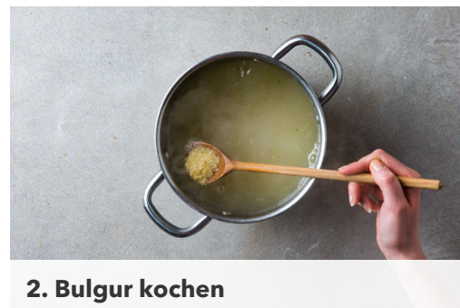
2. Bulgur kochen

Die Zitronenschale abreiben, dann die Zitrone halbieren und auspressen. Den Bulgur mit der Paprika und dem Spinat vermengen und mit 1-2EL Olivenöl und 1-2EL Zitronensaft würzen.