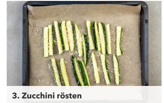
3. Zucchini rösten

Die Kartoffeln zu einem Püree stampfen und mit den Lauchzwiebeln , dem übrigen Panko-Paniermehl , 3EL Mehl und dem Lachs vermengen. 1 Ei verquirlen und mit je 1 kräftigen Prise Salz und Pfeffer gründlich unter die Kartoffelmasse kneten. Nach Bedarf etwas mehr Mehl hinzufügen, falls die Kartoffelmasse zu klebrig ist. Mit angefeuchteten Händen 12 flache Kuchlein formen.