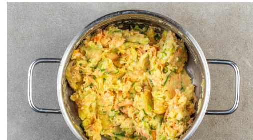
5. Kuchlein formen

Die Zucchini einmal längs und einmal quer halbieren, dann der Länge nach in fingerdicke Stifte schneiden. Mit 1 kräftigen Prise Salz bestreuen und 4-5Min. ziehen lassen. Dann die ausgetretene Flüssigkeit gut abtupfen.