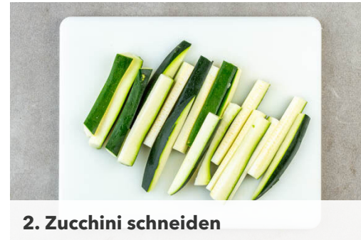
2. Zucchini schneiden

Den Dill abzupfen und fein schneiden. Die Gurke in dünne Scheiben schneiden und mit 1EL Pflanzenöl, 1EL Essig und je 1 kräftigen Prise Zucker, Salz und Pfeffer vermengen, dann die ½ des Dills untermischen. Die Haut entfernen und den Lachs mit einer Gabel grob zerteilen, evtl. vorhandene Gräten mit einer Pinzette entfernen.