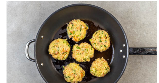
6. Kuchlein braten

Die Zucchini in der ½ des Panko-Paniermehls wenden, auf einem mit Backpapier ausgelegten Backblech verteilen und 10-12Min. im Ofen rösten, bis sie knusprig und gar sind.