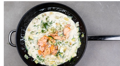
5. Sauce kochen

Inzwischen die Haut entfernen und den Lachs mit einer Gabel grob zerteilen, evtl. vorhandene Gräten mit einer Pinzette entfernen.