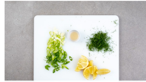
2. Zutaten vorbereiten

Die Zucchini längs vierteln und in dünne Scheiben schneiden.