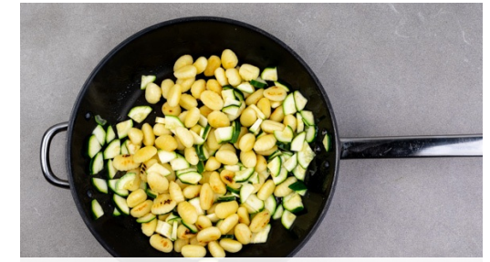
3. Gnocchi braten

Die Lauchzwiebel schräg in feine Ringe schneiden. Die Dillspitzen von den Stängeln zupfen und fein schneiden. Die Zitrone halbieren und eine Hälfte auspressen, die andere Hälfte in Spalten schneiden.