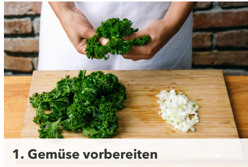
1. Gemüse vorbereiten

Energie 1263kcal, Fett 90.8g, Kohlenhydrate 74.7g, Eiweiß 34.9g