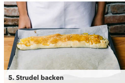
5. Strudel backen

Den Teig mit dem Papier nach unten auf der Arbeitsfläche ausrollen. Die Meerrettichcreme auf dem Teig verstreichen, dabei an den Längsseiten einen ca. 1,5cm breiten Rand frei lassen. Den Grünkohl und den Lachs gleichmäßig auf der Creme verteilen und den Teig von einer Längsseite zur anderen vorsichtig aufrollen.