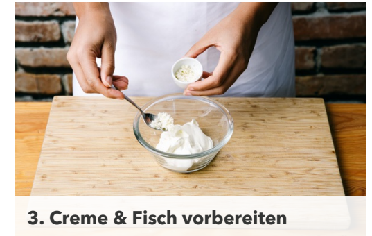
3. Creme & Fisch vorbereiten

Die Zwiebeln in einer mittelgroßen Pfanne mit 1EL Olivenöl bei mittlerer 1-2Min. farblos anschwitzen. Dann den Grünkohl dazugeben und 3-4Min. mitbraten, bis er zusammenfällt. Mit Salz und Pfeffer abschmecken.