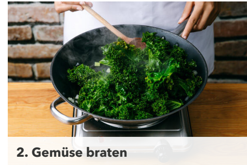
2. Gemüse braten

Den Backofen auf 200°C (180°C Umluft) vorheizen. Die Zwiebel schälen, halbieren und in feine Würfel schneiden. Den Grünkohl in grobe Stücke zupfen, dabei die harten Stiele entfernen.