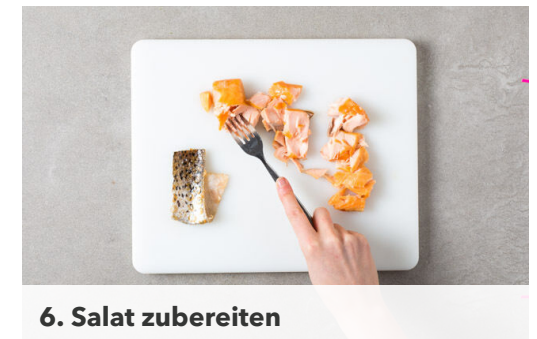
6. Salat zubereiten

Den Strudel mit der Naht nach unten legen und die Enden mit einer Gabel zusammendrücken. Den Strudel mit dem Backpapier auf ein Backblech legen. Die Oberfläche mit 1EL Olivenöl bestreichen und den Strudel auf der mittleren Schiene in 18-20Min. goldbraun und gar backen.