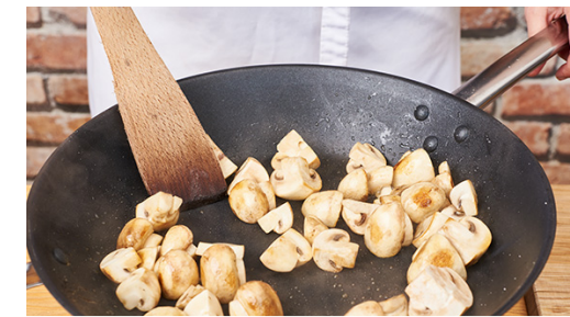
3. Pilze braten

Aus 2EL Olivenöl, 2EL Essig, 2EL Wasser, 1TL Senf und ½TL Zucker ein Dressing anrühren. Mit Salz und Pfeffer abschmecken und den Rucola unterheben.