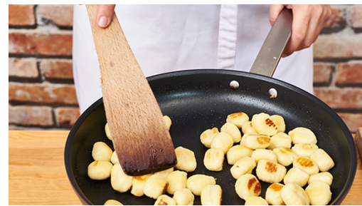
2. Gnocchi braten

Die Limettenschale fein abreiben, dann die Limette halbieren und auspressen. Die Crème fraîche mit 1EL Wasser, Limettensaft und -schale nach Geschmack sowie Salz, Pfeffer und Zucker würzen.