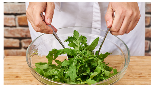
5. Salat zubereiten

Die Gnocchi in einer großen Pfanne mit 2EL Olivenöl bei mittlerer Hitze 4-5Min. anbraten, bis sie von allen Seiten goldbraun sind. Die Gnocchi aus der Pfanne nehmen und beiseitestellen.