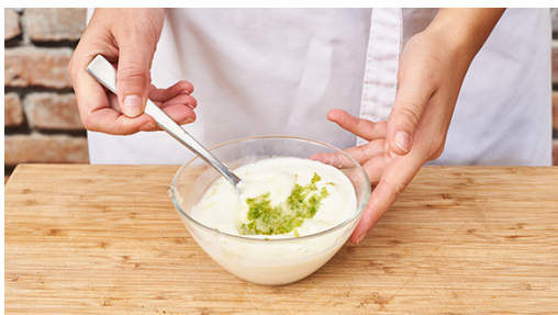
4. Crème fraîche verfeinern

Die Pilze ggf. säubern und vierteln. Die Zwiebel schälen und in feine Würfel schneiden. Den Knoblauch schälen und ebenfalls fein würfeln.