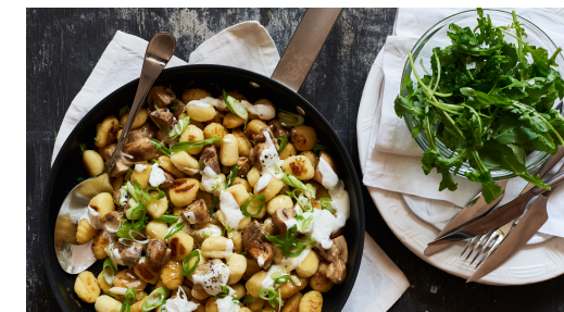
6. Schnittlauch schneiden

Die Pilze , die Zwiebeln und den Knoblauch in derselben Pfanne mit 2EL Olivenöl bei mittlerer Hitze 5-6Min. braten. Mit Salz und Pfeffer würzen. Tipp: Wer mag, kann auch weniger Knoblauch verwenden.