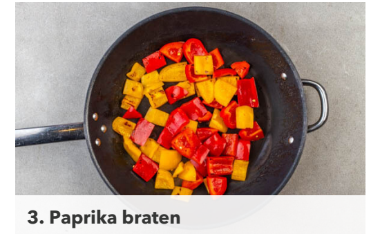
3. Paprika braten

Inzwischen die Paprika vierteln, entkernen und in ca. 3cm große Stücke schneiden. Die Granatapfelmelasse mit 3EL Olivenöl und 1EL Essig zu einem Dressing verrühren.