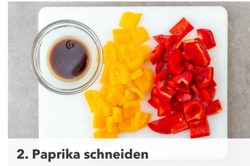
2. Paprika schneiden

In einem großen Topf 1L Wasser mit der Gewürzmischung zum Kochen bringen. Die Linsen in einem Sieb mit kaltem Wasser abspülen, in das kochende Wasser geben und abgedeckt bei niedriger Hitze 18-20Min. sanft köcheln lassen, bis die Linsen bissfest sind.