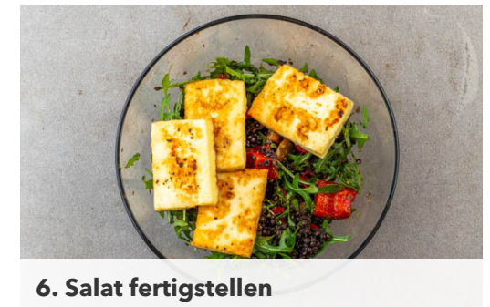
6. Salat fertigstellen

Die Peperoni in feine Ringe schneiden. Die Zitronenschale fein abreiben, dann die Zitrone halbieren und auspressen. 1EL Zitronensaft mit der Peperoni und dem Rucola vermengen und mit 1 kräftigen Prise Salz würzen.