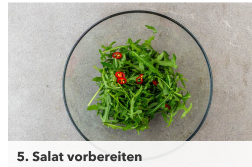
5. Salat vorbereiten

Inzwischen den Käse vierteln. Den Oregano in die Pfanne geben und ca. 1Min. weiterbraten, dann die Paprika aus der Pfanne nehmen und mit dem Dressing vermengen. Den Käse in derselben Pfanne mit 1EL Olivenöl unter gelegentlichem Wenden ca. 2Min. auf jeder Seite braten, bis er rundum goldbraun und knusprig ist.