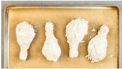
1. Fleisch vorbereiten

Energie 778kcal, Fett 43.6g, Kohlenhydrate 45.7g, Eiweiß 45.7g