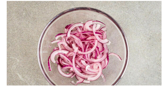
3. Zwiebeln einlegen

Das Fleisch mit 3EL Olivenöl beträufeln, in den noch vorheizenden Ofen schieben und 35-40Min. im Ofen backen. Tipp: Nach der Hälfte der Garzeit ggf. noch etwas Olivenöl über das Fleisch träufeln, um sicherzustellen, dass alle bemehlten Flächen mit Öl bedeckt sind.