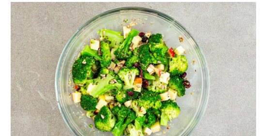
6. Fertigstellen & servieren

In einem großen Topf ausreichend gesalzenes Wasser für den Brokkoli zum Kochen bringen. Den Brokkoli in mundgerechte Röschen schneiden, den Strunk ebenfalls klein schneiden, ggf. vorher schälen. Den Brokkoli 4-6Min. kochen, bis er gar, aber noch bissfest ist. Inzwischen die Äpfel vierteln, entkernen und in kleine Würfel schneiden.