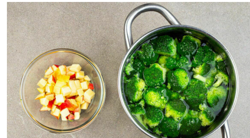
5. Brokkoli garen

1EL Senf mit 2EL Mayonnaise, 2EL Essig, 2TL Wasser und 1TL Honig zu einem Dressing verrühren. Mit Salz und Pfeffer abschmecken.