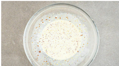
4. Dressing anrühren

Die Zwiebel schälen, halbieren und in feine Streifen schneiden, dann mit 2EL Essig, ½TL Salz sowie 1EL Wasser vermengen und beiseitestellen.