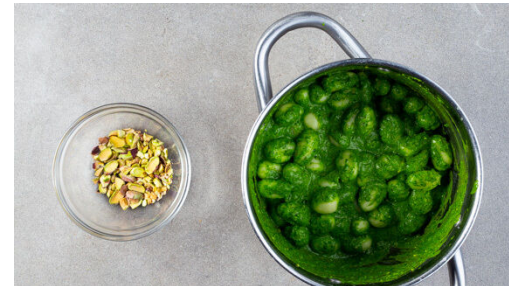
5. Gnocchi vermengen

Das Basilikum samt Stängeln grob schneiden. Die Zitronenschalen fein abreiben und die Zitronen halbieren, zwei Hälften auspressen, die übrigen Hälften in Spalten schneiden. Das Basilikum , die Zitronenschale , die ½ der Pistazien und die Hefeflocken in ein hohes Gefäß geben.