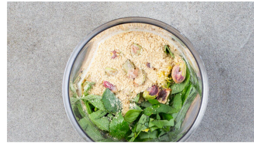
2. Pesto vorbereiten

Die Gnocchi in das kochende Wasser geben und 2-3Min. kochen lassen, bis die Gnocchi gar sind und an der Oberfläche schwimmen.