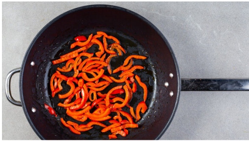
1. Gemüse braten

Energie 721kcal, Fett 29.3g, Kohlenhydrate 95.5g, Eiweiß 20.8g