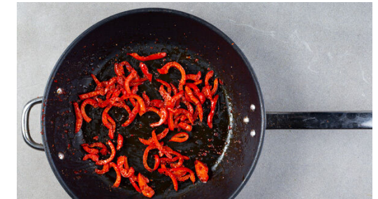
6. Paprika verfeinern

1EL Zitronensaft , 4EL Olivenöl, 4EL Wasser, 1TL Salz und 1 kräftige Prise Pfeffer dazugeben und alles mit einem Stabmixer in 1-2Min. zu einem glatten Pesto pürieren. Dann den Spinat portionsweise mitpürieren und das Pesto mit Salz und Pfeffer abschmecken.