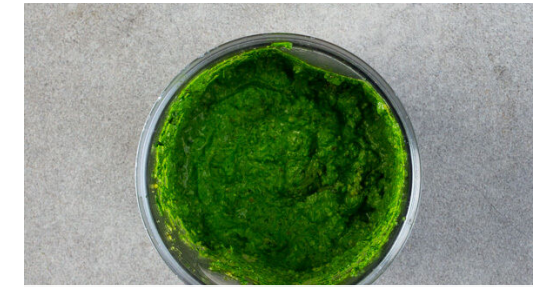
3. Pesto pürieren

Die Gnocchi in ein Sieb abgießen, zurück in den Topf geben und mit dem Pesto vermengen. Die restlichen Pistazien grob hacken.