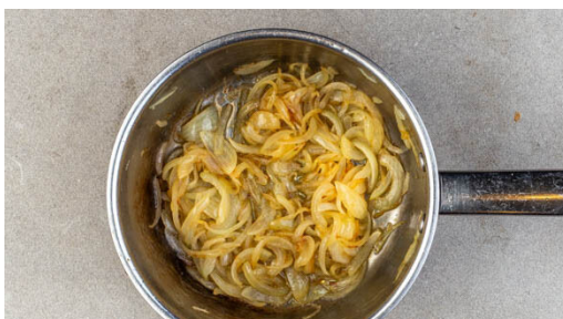
1. Zwiebeln braten

Energie 1128kcal, Fett 56.1g, Kohlenhydrate 129.8g, Eiweiß 29.9g