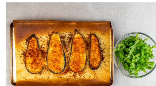
6. Auberginen überbacken

Den Käse fein reiben. Die Zitrone halbieren, von einer Hälfte die Schale abreiben und auspressen. Die andere Hälfte wird nicht benötigt. Die ½ des Käses und die Zitronenschale mit der ½ des Paniermehls vermengen. 1EL Olivenöl, ½EL Zitronensaft und je 1 Prise Salz und Pfeffer zu einem Dressing verrühren. Die Petersilie samt Stängeln fein hacken.