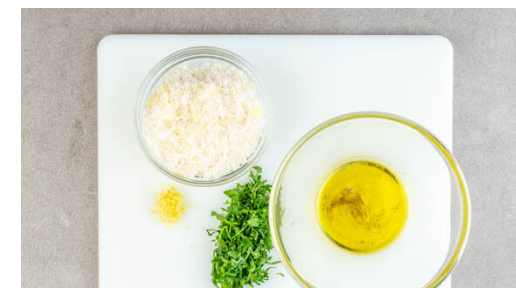
3. Zutaten vorbereiten

Die Gnocchi in einer mittelgroßen Pfanne mit 1EL Olivenöl bei mittlerer Hitze 4-6Min. anbraten, bis sie anfangen, appetitlich zu bräunen. Die Sauce und die ½ der Petersilie hinzugeben, aufkochen lassen und mit Salz und Pfeffer abschmecken.