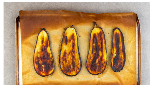
2. Auberginen grillen

Die Zwiebeln mit der Béchamelsauce und 100ml Milch vermengen und zum Kochen bringen. Dann vom Herd nehmen und die Sauce mit Salz und Pfeffer abschmecken.