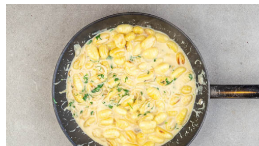
5. Gnocchi braten

Die Aubergine längs in fingerdicke Scheiben schneiden, auf ein mit Backpapier ausgelegtes Backblech legen, von allen Seiten mit 2EL Olivenöl einreiben und mit 1 kräftigen Prise Salz würzen. Die Auberginen auf der oberen Schiene des Ofens ca. 10Min. pro Seite goldbraun grillen. Tipp: Dabei ca. 10cm Abstand zwischen dem Grill und den Auberginen lassen.