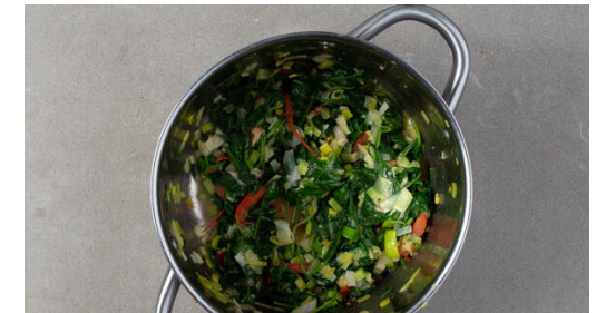
6. Gemüse zubereiten

Die Orangenschale fein abreiben, dann die Orange halbieren und auspressen. Die Oliven grob hacken. Den Knoblauch schälen und fein würfeln.