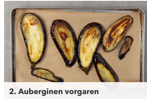
2. Auberginen vorgaren

Die Oliven mit dem gehackten Lauch und 2EL Olivenöl vermengen und die Gremolata mit der Orangenschale und je 1 Prise Salz und Pfeffer abschmecken.