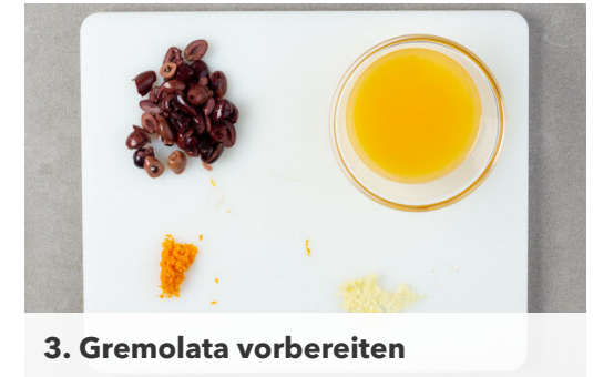
3. Gremolata vorbereiten

Den Fisch kalt abspülen, trocken tupfen und evtl. vorhandene Gräten mit einer Pinzette entfernen. Dann auf die Auberginen legen, mit der Gremolata bestreichen und 7-9Min. im Ofen backen, bis der Fisch gar ist.