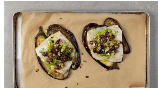
5. Fisch backen

Die Auberginenscheiben mit 3EL Olivenöl beträufeln und 7-9Min. im Ofen grillen bzw. backen. Den Ofen anschließend auf 220°C (200°C Umluft) umschalten.