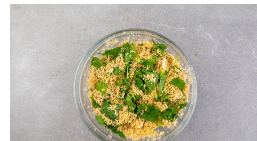
6. Couscous fertigstellen

In einem Wasserkocher ca. 250ml Wasser für den Couscous aufkochen. Die Artischocken mit 1EL Olivenöl, der Gewürzmischung nach Geschmack sowie Salz und Pfeffer vermengen und auf einem weiteren mit Backpapier belegten Backblech verteilen. Im Ofen auf einer unteren Schiene ca. 25Min. rösten.