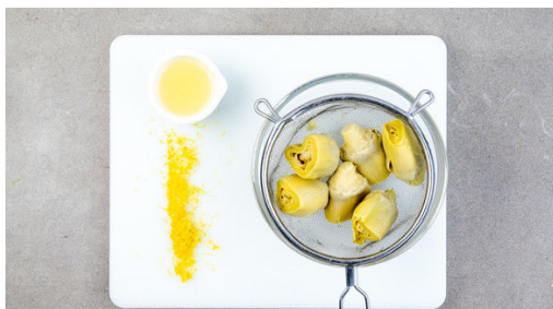
1. Artischocken abgießen

Kalorien 632.0kcal, Fett 19.8g, Eiweiß 18.2g, Kohlenhydrate 81.3g