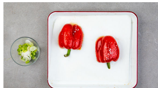
2. Paprika rösten

Den Couscous in einer großen Schüssel mit 1TL Zitronenabrieb , den Lauchzwiebeln , 1EL Olivenöl sowie Salz und Pfeffer mischen, mit dem kochenden Wasser übergießen und abgedeckt 8-10Min. ziehen lassen.