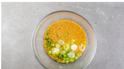
4. Couscous garen

Den Backofen auf 200°C Umluft (220°C Ober-/Unterhitze) vorheizen. Die Artischocken in ein Sieb abgießen und anschließend mit etwas Küchenpapier trocken tupfen. Die Zitronenschale abreiben, dann die Zitrone halbieren und auspressen.