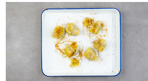
3. Artischocken backen

Die getrockneten Tomaten grob schneiden. Die geröstete Paprika und die getrockneten Tomaten in einem hohen Gefäß mit einem Stabmixer fein pürieren und die Sauce mit Salz und Pfeffer abschmecken. Etwas Wasser hinzufügen, falls die Sauce zu dickflüssig ist.