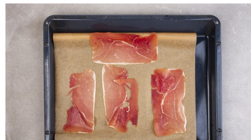
2. Schinken rösten

Den Backofen auf 180°C Umluft (200°C Ober-/Unterhitze) vorheizen. Die Lauchzwiebel schräg in feine Ringe schneiden.