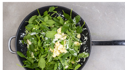
5. Sauce ansetzen

Den Käse fein reiben. Die Brühwürfel in 400ml heißem Wasser auflösen.