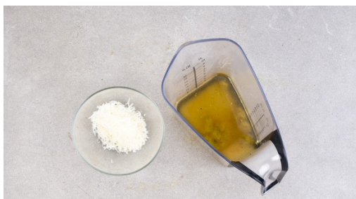
4. Käse reiben

Die Gnocchi in einer großen Pfanne mit 3-4EL Olivenöl bei mittlerer Hitze 6-8Min. goldbraun anbraten.