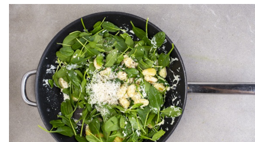
6. Käse unterrühren

Die Crème fraîche und die 1/2 der Brühe unter die Gnocchi rühren und einmal aufkochen lassen, dann den Spinat hinzugeben.