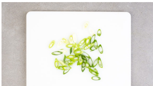
1. Lauchzwiebel schneiden

Energie 820kcal, Fett 40.5g, Kohlenhydrate 85.9g, Eiweiß 27.4g