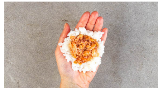
5. Reis füllen

Den Reis in einem Sieb kalt abspülen, bis das Wasser klar bleibt. Sobald das Wasser kocht, den Reis hineingeben und abgedeckt bei niedrigster Hitze 18-20Min. kochen, bis das Wasser aufgesogen und der Reis gar ist. Noch ca. 5Min. ohne Hitzezufuhr ziehen lassen. 2TL hellen Essig und ½TL Zucker einrühren, auf einem großen Teller ausbreiten und in den Kühlschrank stellen.