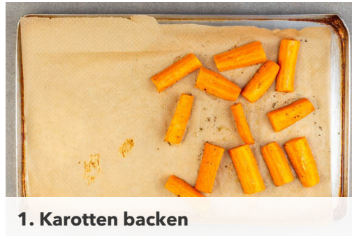
1. Karotten backen

Energie 907kcal, Fett 48.0g, Kohlenhydrate 66.4g, Eiweiß 25.6g