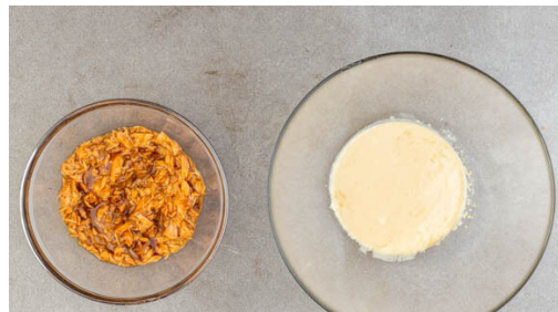
4. Dressing zubereiten

Den Backofen auf 220°C (200°C Umluft) vorheizen. In einem mittelgroßen Topf 600ml leicht gesalzenes Wasser für den Reis zum Kochen bringen. Die Karotten längs halbieren und in ca. 5cm lange Stücke schneiden. Auf ein mit Backpapier ausgelegtes Backblech geben, mit 1EL Pflanzenöl und je 1 Prise Salz und Pfeffer vermengen und ca. 10Min. im Ofen backen.