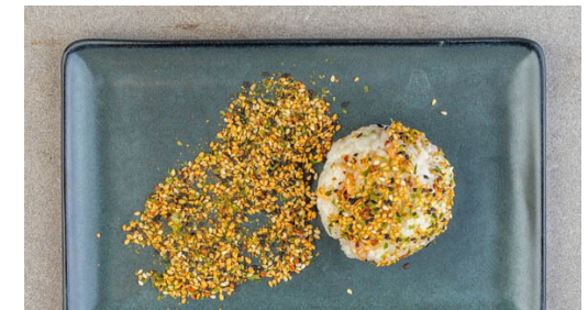
6. Onigiri fertigstellen

Mit einem scharfen Messer die Haut vom Fisch entfernen. Den Fisch trocken tupfen, evtl. vorhandene Gräten entfernen und mit 1EL Pflanzenöl beträufeln. Wenn die Karotten ca. 10Min. gebacken haben, den Fisch ebenfalls auf das Blech legen und 13-15Min. weiterbacken, bis die Karotten weich sind und der Fisch gar ist.