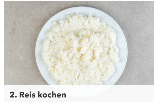
2. Reis kochen

Inzwischen den Ingwer schälen und fein reiben. 4EL Mayonnaise, 1-2TL Ingwer , das Sesamöl , 2TL Sojasauce , 1TL Honig und 2EL hellen Essig zu einem Dressing verrühren. Abschmecken und ggf. nachwürzen. Den Fisch mit der Teriyakisauce vermengen und mit einer Gabel in kleine Stücke zerteilen.