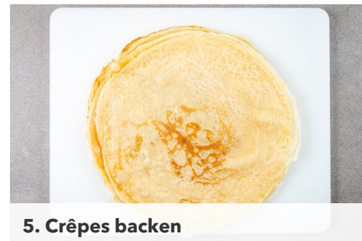
5. Crêpes backen

Die Birnen , die Orangenschale , den Orangensaft , 150g Zucker , den Zimt und 150ml Wasser in einem kleinen Topf vermengen, bis sich der Zucker auflöst. Bei starker Hitze aufkochen und anschließend bei mittlerer Hitze 10-15Min. einköcheln lassen, bis das Kompott eine karamellartige Konsistenz hat. Gelegentlich umrühren.