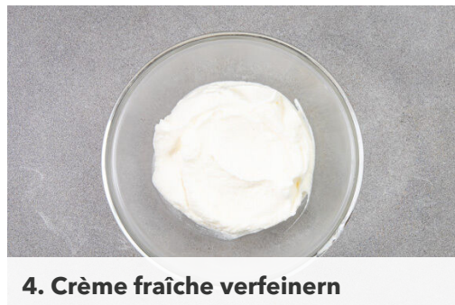
4. Crème fraîche verfeinern

Die Birnen schälen, vierteln, entkernen und in mundgerechte Stücke schneiden. Die Orangenschale abreiben, dann die Orange halbieren und auspressen.