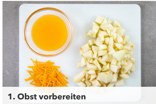
1. Obst vorbereiten

Energie 845kcal, Fett 30.1g, Kohlenhydrate 124.4g, Eiweiß 18.5g