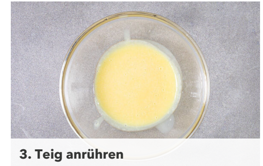
3. Teig anrühren

In einer großen Pfanne ½TL Pflanzenöl oder Butter bei mittlerer Hitze erwärmen. Die Pfanne vom Herd nehmen und ca. 100ml Teig für 1 Crêpe hineingeben, dabei die Pfanne leicht schwenken, um den Teig gleichmäßig rund auf dem Pfannenboden zu verteilen. Die Crêpe 1-2Min. ausbacken, dann wenden und weitere ca. 30Sek. backen. Den Vorgang wiederholen, bis der Teig aufgebraucht ist.