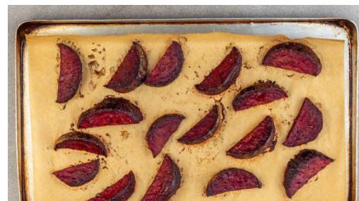
2. Rote Bete rösten

Den Backofen auf 240°C (220°C Umluft) vorheizen. Die Pekannüsse auf einem mit Backpapier ausgelegtem Backblech verteilen und im vorheizenden Backofen 2-4Min. rösten, bis sie duften.