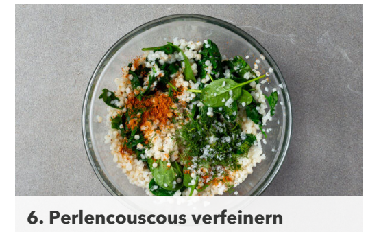
6. Perlencouscous verfeinern

Den Perlencouscous in das kochende Wasser geben und in 8-10Min. bissfest kochen.