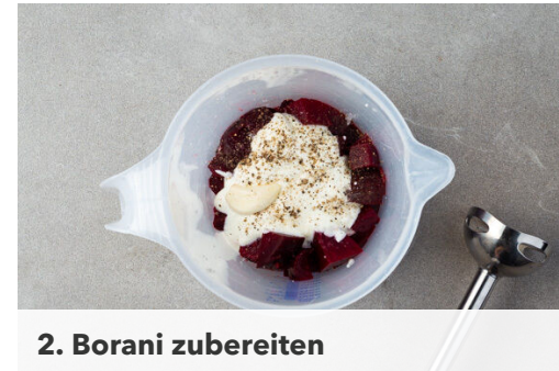
2. Borani zubereiten

Den Spinat in ein Sieb geben und den Perlencouscous in das Sieb abgießen, sodass der Spinat durch das heiße Wasser zusammenfällt. Den Spinat und den Perlencouscous in eine Schüssel oder zurück in den Topf geben und 1EL Olivenöl unterrühren.