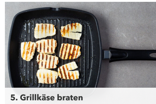
5. Grillkäse braten

Die Rote Bete mit der ½ des Knoblauchs oder mehr nach Geschmack, 1EL Zitronensaft , dem Joghurt und je 1 Prise Salz und Pfeffer in einem hohen Gefäß möglichst glatt pürieren.