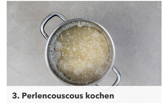
3. Perlencouscous kochen

Den Grillkäse in ca. 8 Scheiben schneiden und rundum mit 1EL Olivenöl einreiben. Anschließend in einer Grillpfanne oder einer normalen Pfanne bei mittlerer Hitze auf jeder Seite 2-3Min. anbraten, bis der Grillkäse weich wird und appetitlich gebräunt ist.