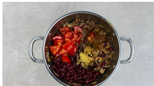
4. Chili köcheln

Die Kartoffeln schälen und je nach Größe halbieren oder vierteln, dann in das kochende Wasser geben und in 15-20Min. gar kochen. Tipp: Die Kartoffeln sind durch, wenn sie sich bei der Messerprobe leicht vom Messer lösen. Mit einer Tasse etwas Kochwasser abschöpfen, dann die Kartoffeln in ein Sieb abgießen.