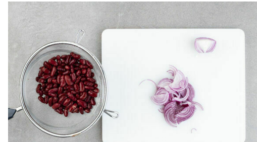
2. Zutaten vorbereiten

In einem mittelgroßen Topf ausreichend gesalzenes Wasser für die Kartoffeln zum Kochen bringen. Die Tomaten grob würfeln.