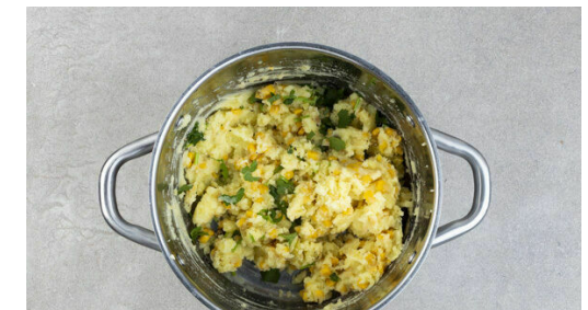
6. Zwiebel würfeln

Die Kartoffeln zurück in den Topf geben und zu einem cremigen Püree stampfen, dabei nach Bedarf etwas Kochwasser hinzugeben. Tipp: Wer mag, kann noch 1EL Butter hinzufügen. Den Mais abgießen, untermengen und das Püree mit Salz und Pfeffer abschmecken.