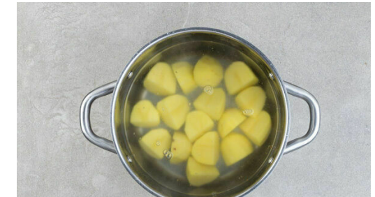
3. Kartoffeln kochen

Die Bohnen in einem Sieb mit kaltem Wasser abspülen und abtropfen lassen. Die Zwiebeln schälen und halbieren. 1 Zwiebelhälfte beiseitelegen, die restlichen Zwiebelhälften in dünne Streifen schneiden.