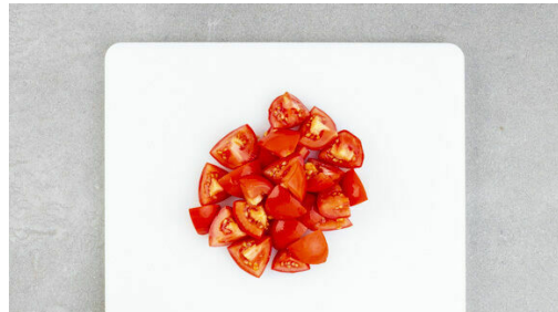
1. Tomaten schneiden

Energie 685kcal, Fett 25.1g, Kohlenhydrate 70.2g, Eiweiß 38.5g