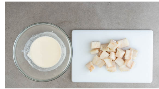
2. Fisch vorbereiten

Die Zwiebeln und die Karotten in einer zweiten Pfanne mit 2EL des Fisch-Bratöls bei mittlerer Hitze ca. 5Min. braten. Inzwischen die Paprika vierteln, entkernen und in dünne Streifen schneiden. Die ½ des Ingwers oder mehr schälen und fein reiben. Die Paprika , den Ingwer und 1EL Wasser in die Pfanne geben und 3-5Min. weiter braten, bis das Gemüse sehr weich ist.