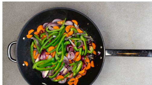
4. Gemüse braten

In einem kleinen Topf 300ml leicht gesalzenes Wasser zum Kochen bringen. Den Reis in einem Sieb kalt abspülen, bis das Wasser klar bleibt. Die Zwiebel schälen, halbieren und in feine Streifen schneiden. Die Karotte ggf. schälen, längs halbieren und schräg in dünne Scheiben schneiden.