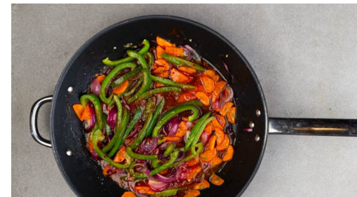
5. Sauce köcheln

Den Reis in das kochende Wasser geben und abgedeckt bei niedrigster Hitze 10-12Min. kochen, bis das Wasser aufgesogen und der Reis gar ist. Abgedeckt beiseitestellen. Den Fisch trocken tupfen und in ca. 3cm große Stücke schneiden. Eine große Pfanne ca. 2cm hoch mit Pflanzenöl befüllen und bei starker Hitze erwärmen. Die Maisstärke , 3EL Mehl, ½TL Salz und 85ml Wasser glatt rühren.