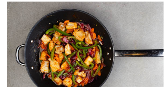
6. Fisch vermengen

Den Fisch vorsichtig mit der Stärkemischung vermengen, bis er vollständig bedeckt ist. Den Fisch z. B. mithilfe einer Küchenzange oder Stäbchen etwas abtropfen lassen, dann ggf. portionsweise in das heiße Öl geben und in 3-5Min. goldbraun braten, dabei nach der Hälfte der Zeit wenden. Auf etwas Küchenkrepp abtropfen lassen.