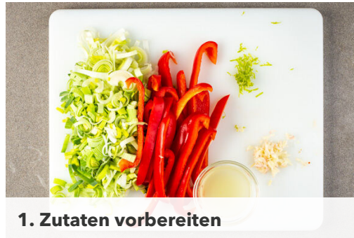
1. Zutaten vorbereiten

Energie 842kcal, Fett 44.1g, Kohlenhydrate 69.4g, Eiweiß 38.0g