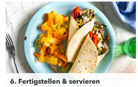
6. Fertigstellen & servieren

Den Lauch und den Knoblauch hinzufügen und bei mittlerer Hitze in 5-6Min. weich braten. Die Hackfleischfüllung nach Geschmack mit der ½ des Limettensafts sowie Salz und Pfeffer verfeinern.