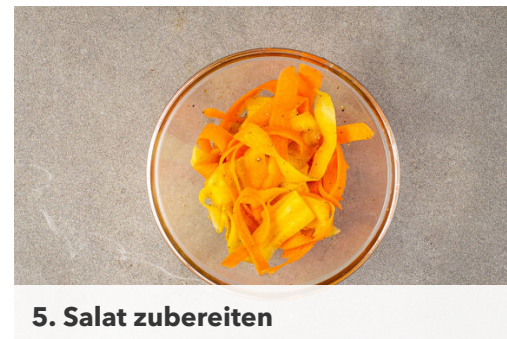
5. Salat zubereiten

Das Hackfleisch in einer großen Pfanne mit 1EL Pflanzenöl sowie je 1 kräftigen Prise Kreuzkümmel-Gewürzmischung und Salz bei starker Hitze ca. 2Min. kross anbraten, dabei gelegentlich umrühren.