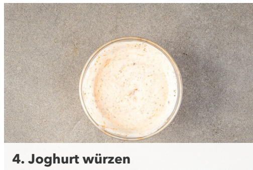
4. Joghurt würzen

Die Paprika vierteln, entkernen und in dünne Streifen schneiden. Den Lauch längs halbieren und quer in feine Streifen schneiden. Den Knoblauch schälen und grob würfeln. Die Limettenschale abreiben, dann die Limette halbieren und auspressen.