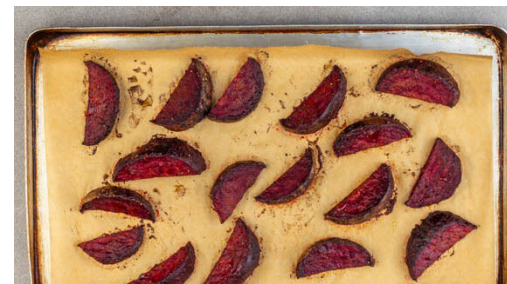
2. Rote Bete rösten

Den Backofen auf 240°C (220°C Umluft) vorheizen. Die Pekannüsse auf einem mit Backpapier ausgelegtem Backblech verteilen und im vorheizenden Backofen 2-4Min. rösten, bis sie duften.