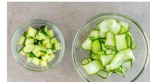
3. Gurke vorbereiten

Währenddessen die Rote Bete in ca. 2cm breite Spalten schneiden. Die Pekannüsse aus dem Ofen nehmen und beiseitestellen. Die Rote Bete auf demselben Backblech mit 1EL Olivenöl, der Gewürzmischung sowie je 1 Prise Salz und Pfeffer vermengen, gleichmäßig verteilen und im Ofen 20-25Min. rösten.