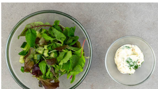
4. Salat & Mayo vorbereiten

Die Gurke mit einem Sparschäler rundum bis zum Kerngehäuse in breite Streifen schneiden, dann das Kerngehäuse grob würfeln und beiseitestellen. Die Gurkenstreifen mit 1EL hellem Essig und 1 kräftigen Prise Zucker vermengen und beiseitestellen.