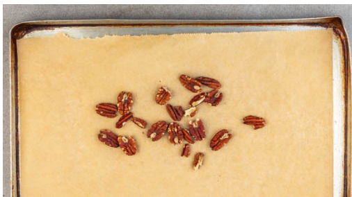
1. Pekannüsse rösten

Energie 995kcal, Fett 64.0g, Kohlenhydrate 76.0g, Eiweiß 27.9g