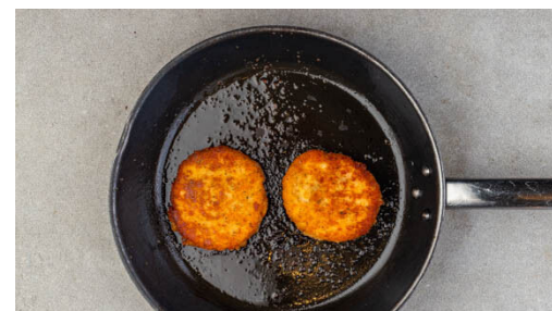
5. Pattys braten

Die Minzeblätter von den Stängeln zupfen. 1EL hellen Essig und ½EL Olivenöl mit je 1 Prise Salz und Pfeffer zu einem Dressing verrühren und kurz vor dem Servieren mit dem Wildkräutersalat , den Gurkenwürfeln und der Minze vermengen. Den Dill fein schneiden, mit 2EL Mayonnaise verrühren und mit Salz und Pfeffer abschmecken.