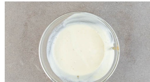
5. Dip anrühren

Die Kartoffeln in die kochende Brühe geben und in 8-10Min. gar kochen.