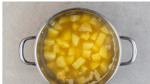
4. Kartoffeln kochen

Die Würste längs halbieren. Mit den Karotten , dem Brokkoli , den Zwiebeln und den Äpfeln auf zwei mit Backpapier ausgelegten Backblechen verteilen und mit je 2EL Olivenöl, je ½TL Salz und dem Gulaschgewürz vermengen. 18-22Min. im Ofen backen, bis die Würste appetitlich gebräunt und durchgegart sind. Je nach Ofen die Position der Bleche nach der Hälfte der Zeit tauschen.