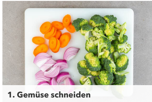
1. Gemüse schneiden

Energie 734kcal, Fett 40.8g, Kohlenhydrate 62.5g, Eiweiß 28.3g