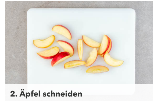
2. Äpfel schneiden

Den Backofen auf 220°C (200°C Umluft) vorheizen. In einem großen Topf ausreichend Wasser für die Kartoffeln mit 2TL Salz und dem Brühwürz zum Kochen bringen. Die Karotten ggf. schälen und schräg in dünne Scheiben schneiden. Den Brokkoli in mundgerechte Röschen zerteilen. Die Zwiebeln schälen und in ca. 1cm breite Spalten schneiden.