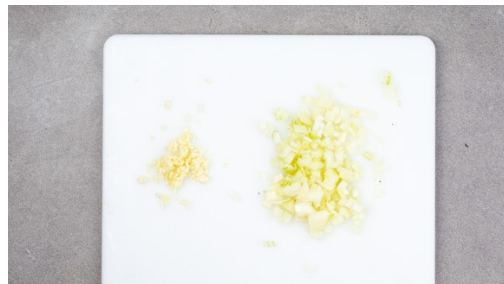
1. Zwiebel schneiden

Energie 825kcal, Fett 23.3g, Kohlenhydrate 104.2g, Eiweiß 47.5g