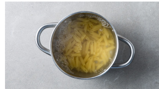
2. Pasta kochen

In einem mittelgroßen Topf ausreichend leicht gesalzenes Wasser für die Pasta zum Kochen bringen. Die Zwiebel schälen und in kleine Würfel schneiden. Den Knoblauch schälen und fein hacken.