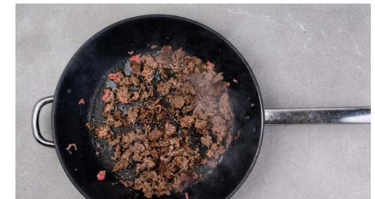
3. Fleisch braten

Sobald das Wasser kocht, die Pasta hineingeben und leicht köchelnd in ca. 9-11 Min. bissfest garen. In ein Sieb abgießen und abtropfen lassen, dabei 1 Tasse Pastawasser auffangen. Die Pasta wieder in den Topf geben und warm halten.