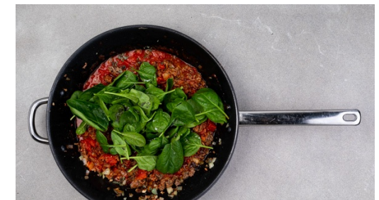
6. Sauce fertigstellen

Den Käse fein reiben. Die Oreganoblättchen von den Stängeln zupfen und fein hacken.