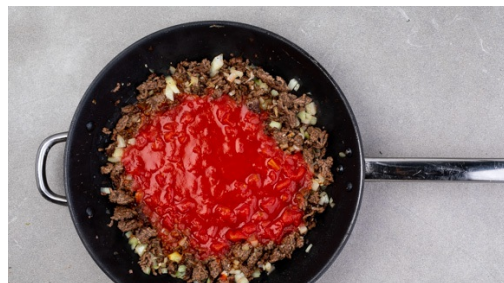
4. Sauce kochen

Inzwischen das Hackfleisch unter Rühren in einer großen Pfanne mit 1-2EL Olivenöl bei starker Hitze krümelig anbraten, mit Salz und Pfeffer würzen.