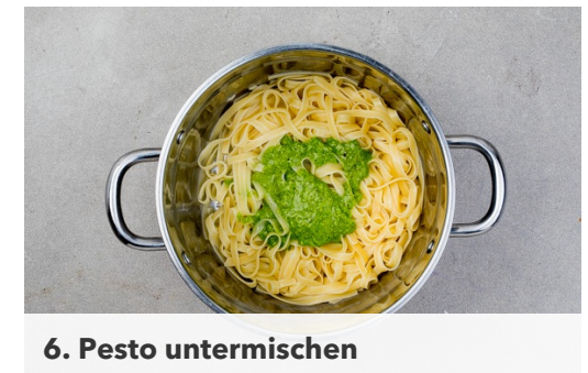
6. Pesto untermischen

Sobald das Wasser kocht, die Pasta hineingeben und in ca. 9-11Min. bissfest kochen. Die Pasta in ein Sieb abgießen und abtropfen lassen, dabei ca. 1 Tasse Pastawasser auffangen.