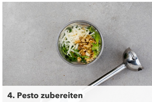
4. Pesto zubereiten

Den Backofen auf 200°C Umluft (220°C Ober-/Unterhitze) vorheizen. In einem großen Topf ausreichend leicht gesalzenes Wasser für die Pasta zum Kochen bringen. Die Kirschtomaten halbieren und in einer Auflaufform mit 1EL Olivenöl, Salz, Pfeffer und Zucker würzen. Die 1/2 der Nüsse grob hacken, die restlichen Nüsse halbieren.