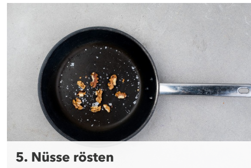
5. Nüsse rösten

Das Fleisch mit etwas Küchenkrepp trocken tupfen, in 4 Medallions schneiden und mit Salz und Pfeffer würzen. Die Medallions in einer großen Pfanne mit 1-2EL Olivenöl bei starker Hitze scharf anbraten, aus der Pfanne nehmen und mit den Tomaten im Ofen in ca. 8-10Min. fertig garen.