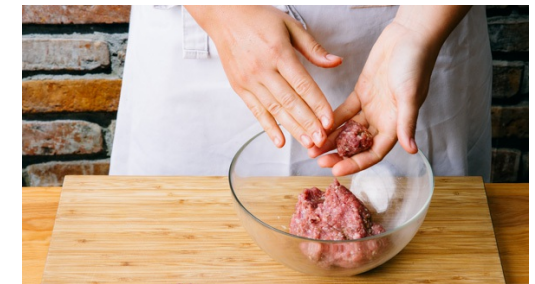
3. Hackbällchen formen

Die Kartoffeln auf einem mit Backpapier belegten Backblech verteilen und im Ofen in ca. 20-30Min. goldbraun rösten. Zwischendurch wenden, damit sie gleichmäßig bräunen. Die Baguettebrötchen in den ersten ca. 2-3Min. mitbacken, herausnehmen und abkühlen lassen.