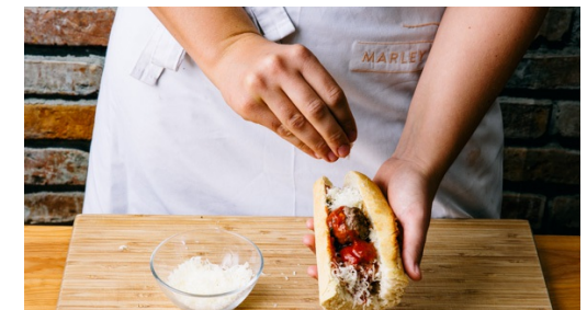
6. Sandwich belegen

Die fertig gebratenen Hackbällchen aus der Pfanne nehmen, dann die passierten Tomaten in die Pfanne geben und mit 1 Prise Zucker, dem restlichen Knoblauch und dem restlichen Gewürz abschmecken. Die 1/2 des Basilikums unterrühren. Die Hackbällchen dazugeben und ca. 4-5Min. in der Sauce mitköcheln lassen. Nach Wunsch mit Salz und Pfeffer nachwürzen.