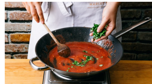
5. Sauce zubereiten

Die Hackbällchen in einer großen Pfanne mit 1-2EL Olivenöl bei mittlerer Hitze in ca. 6Min. rundum goldbraun anbraten. Das Fleisch aus der Pfanne nehmen und warm stellen. Während die Hackbällchen braten, die Basilikumbblätter von den Stängeln zupfen und grob hacken. Den Käse fein reiben.