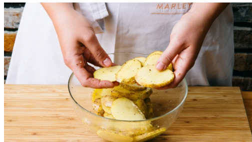
1. Kartoffeln schneiden

Energie 877kcal, Fett 36.6g, Kohlenhydrate 93.5g, Eiweiß 39.5g