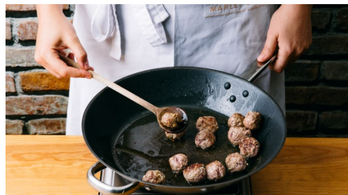
4. Hackbällchen braten

Inzwischen den Knoblauch schälen und fein hacken. Das Hackfleisch mit der 1/2 des Knoblauchs , Salz und Pfeffer verkneten. Mit feuchten Händen etwa walnussgroße Bällchen formen.