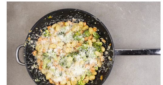
6. Fertigstellen & servieren

Das abgetropfte Gemüse , den Knoblauch und den geschnittenen Salbei zu den Gnocchi in die Pfanne geben und bei mittlerer Hitze unter gelegentlichem Rühren 2-3Min. mitbraten. Die Hitze reduzieren und die Schlagsahne sowie nach Bedarf etwas Kochwasser unterrühren.