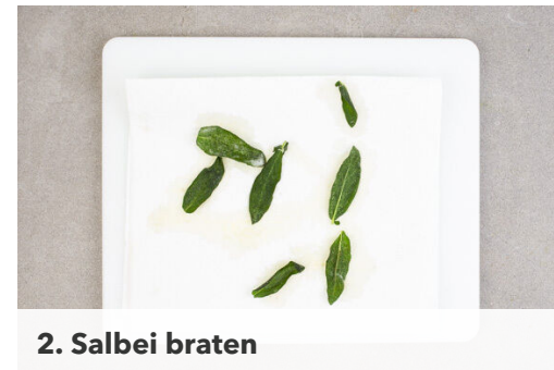
2. Salbei braten

In einem mittelgroßen Topf ausreichend gesalzenes Wasser für die Süßkartoffel und den Brokkoli zum Kochen bringen. Die Süßkartoffel schälen und in kleine Würfel schneiden. Die Salbeiblätter abzupfen und ca. \frac{1}{3} der Salbeiblätter grob schneiden.