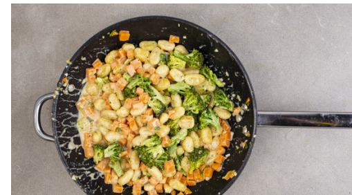
5. Gemüse zugeben

Die Salzeibutter in der Pfanne mittelhoch erhitzen, die Gnocchi zugeben und mit 1 Prise Salz in 6-8Min. goldbraun und knusprig braten. Den Knoblauch schälen und grob würfeln. Die Zitrone halbieren und eine Hälfte auspressen, die andere Hälfte in Spalten schneiden.