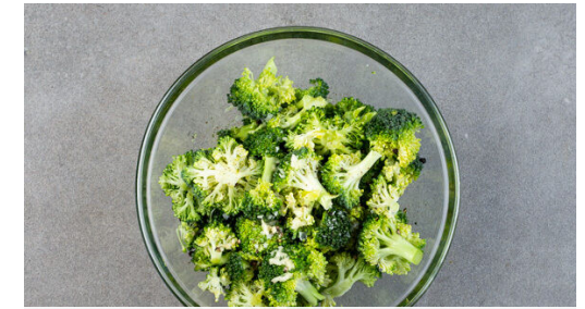
3. Brokkoli würzen

Die Tomaten , die Zwiebeln und den Koriander mit 1-2EL Zitronensaft sowie je 1 Prise Salz und Pfeffer zu einer Salsa vermengen.