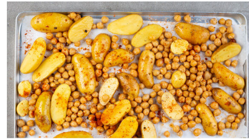
2. Gemüse rösten

Die Tomate in kleine Würfel schneiden. Die Zwiebel schälen, halbieren und fein würfeln. Den Koriander samt Stängeln fein schneiden.