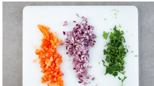
4. Salsa vorbereiten

Den Backofen auf 240°C (220°C Umluft) vorheizen. Die Kichererbsen in einem Sieb mit kaltem Wasser abspülen, abtropfen lassen und gut trocken tupfen. Die Kartoffeln samt Schale je nach Größe halbieren oder vierteln. Die Zitronenschale zur Hälfte abreiben, dann die Zitrone halbieren, eine Hälfte auspressen, die andere Hälfte in Spalten schneiden.