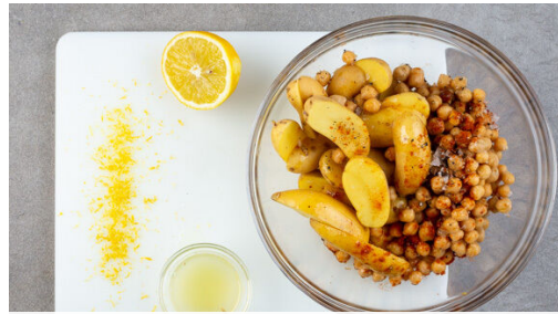
1. Gemüse vorbereiten

Energie 734kcal, Fett 29.8g, Kohlenhydrate 86.3g, Eiweiß 21.8g